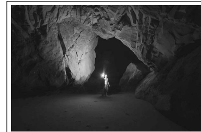
In a Cave

IV Hopefully, the findings of this experiment will be used to improve the living conditions of 25 workers who must spend a long time under the ground. And in the future, they can be useful in planning long journeys into space.