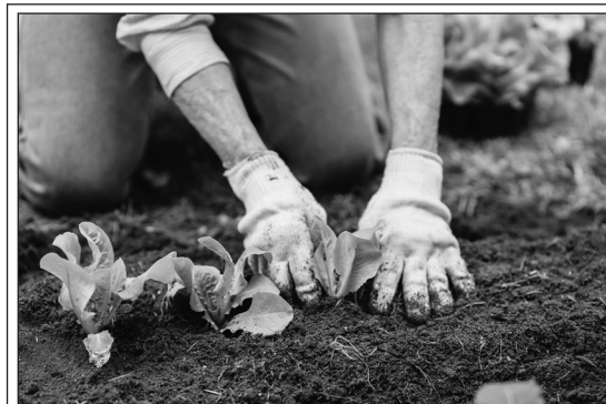
Planting Young Plants

I In the past few years, people started planting community gardens. More and more people are finding land in their neighborhoods and growing gardens. They invite their neighbors and friends to join them. Together they plant fruit trees, vegetables and flowers. These gardens are popular today because people want to do things outside their homes. Also, many people want to grow their own fruits and vegetables. In addition, some people think it's healthier to eat the things that they grow instead of the things that they buy.