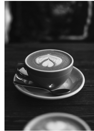
Cup of coffee

III Some farmers are trying to solve this problem by moving higher up the mountains, where it is cooler. However, there is not enough land there for everyone to grow coffee trees, so many farmers may lose their farms and incomes. A better solution is to develop new kinds of coffee trees that can grow well in hotter weather. But this can take 10-20 years. In the meantime, a coffee tree which grows in Sierra Leone, Africa, gives some hope. It is called Coffee Stenophylla . According to recent studies, this tree is less sensitive to changes in temperature. Most importantly, its beans produce a delicious cup of coffee. Coffee experts and coffee lovers are hopeful that Coffee Stenophylla will save the coffee industry.