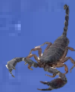
עקרב שחרן יהודה