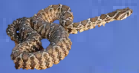
נחש צפע מצוי