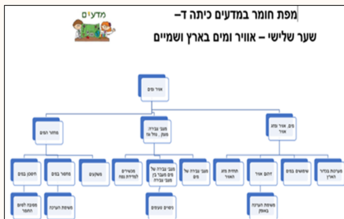
מפת חומר במדעים (ערכה: לירז אביטל)