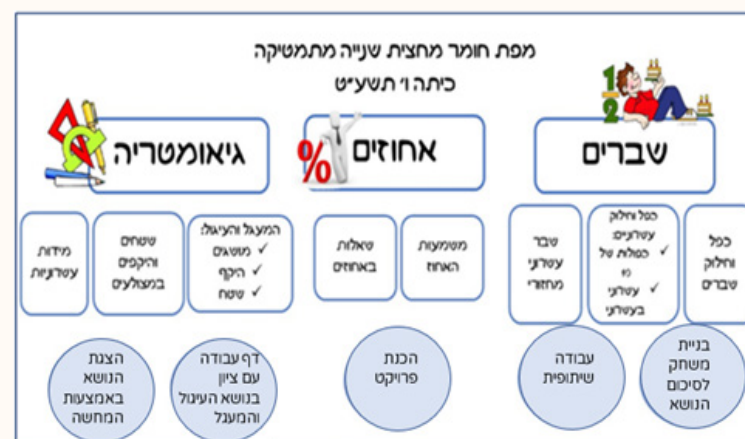
מפת חומר במתמטיקה (ערכה: ענבל שושני)