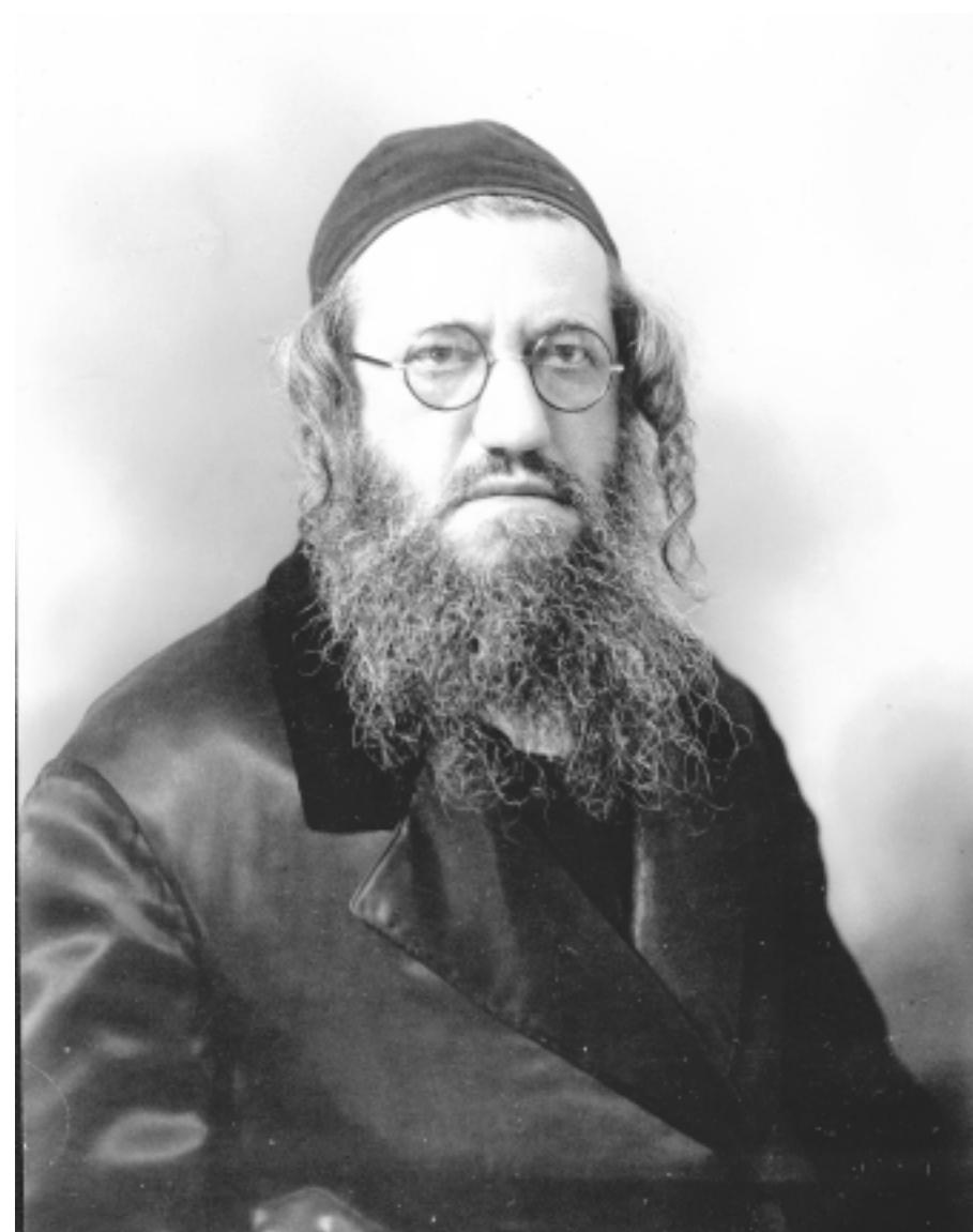
הרז חרז"ק זצ"ל