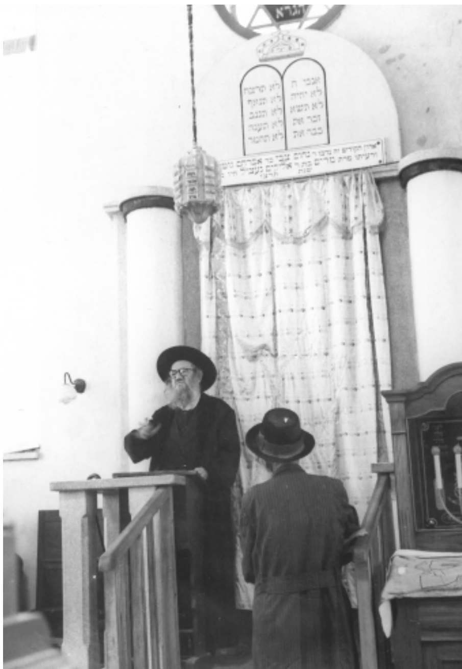
הרב חרל"פ דורש ז"צ א"צ ז"ל

לו ראית את כ"ק אדמו"ר מרן שליט"א בשנות אבלותו על אביו ועל אמו, אז היית יודע מה זה "מכבדו במותו" (קידושין לא, ב), עבודתו הייתה נוראה מאד. לא החסיר יום ללמוד עם מניין אנשים משניות, אפילו ביום הכיפורים ובמוצאי תשעה באב, בשבת, ביום טוב ובחול וכו'.