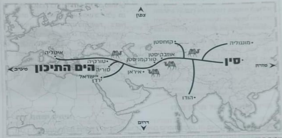
"שמות המדינות ונבולותיהן כתובים ומסומנים במפה כפי שהם בימינו."