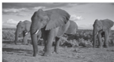
פילים פורשים את אוזניהם בערבות אפריקה

5. לפי הטקסט, הפילים שבתמונה פורשים את אוזניהם כדי –