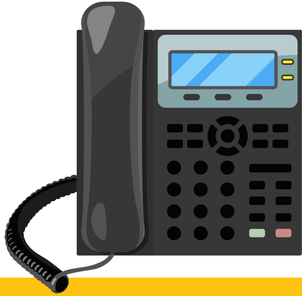
שְׁנַת שְׁמֵעַ בְּשׁוֹרוֹת טוֹבוֹת