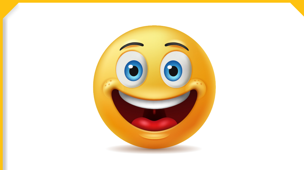
שָׁנַת שְׂמֻחָה וְאִשָּׁר