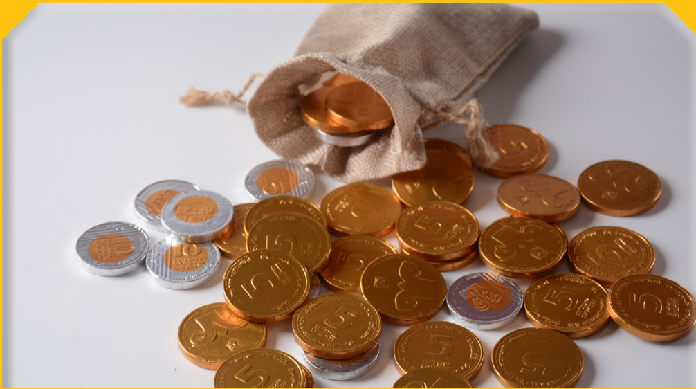
שְׁנַת פְּרִנָּה בְּשִׁפְעַ