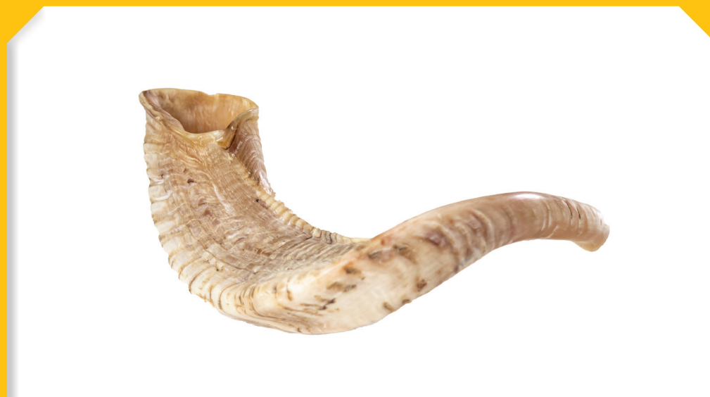
שְׁנַת סְלִיחָה וּמַחִילָה