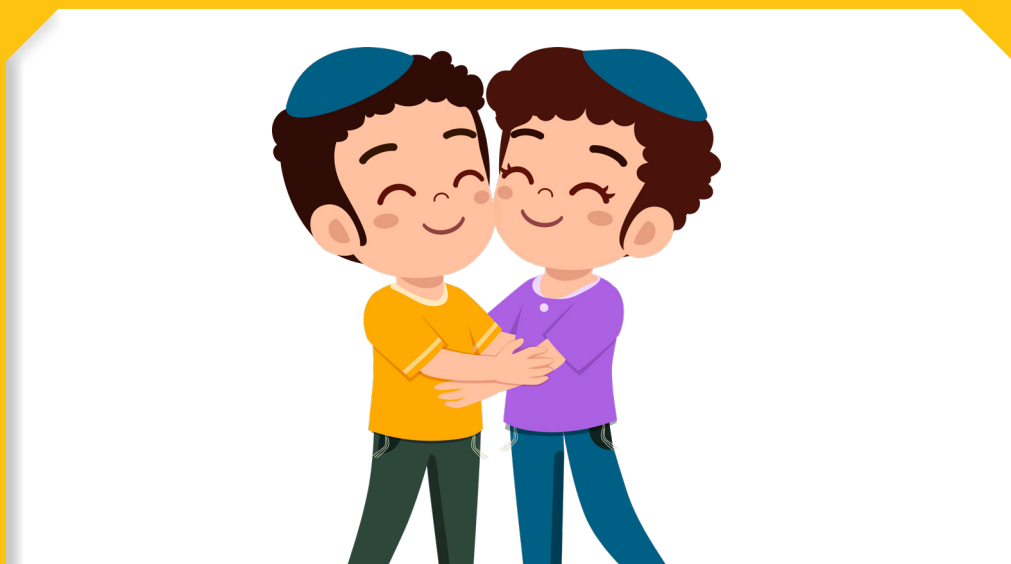
שָׁנָה שֶׁל אֶהָבָה