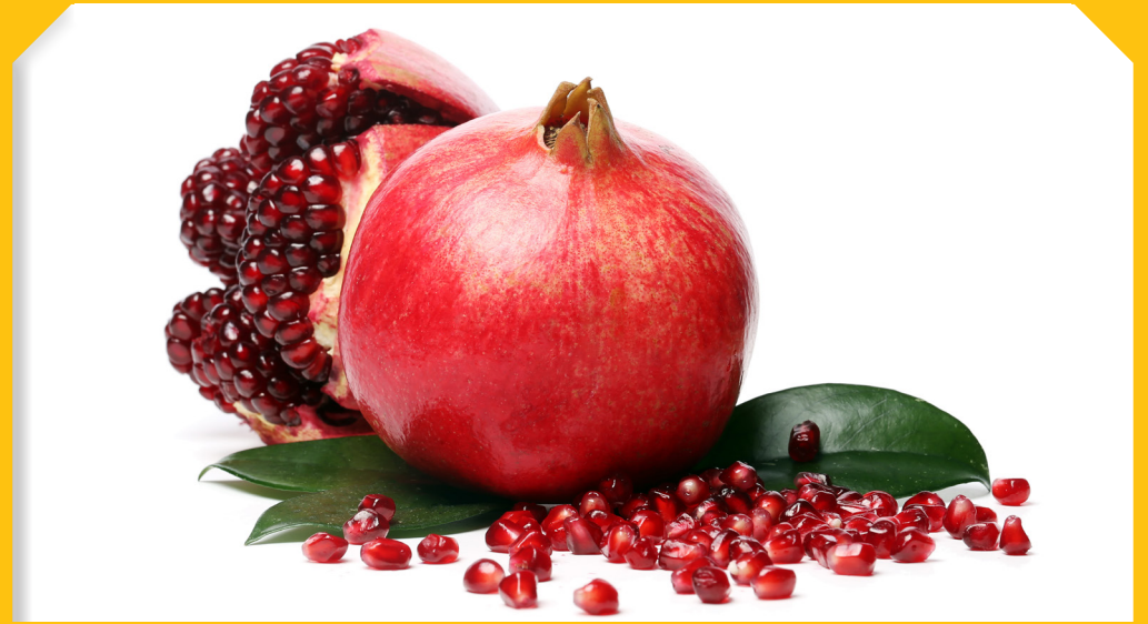
שְׁנַת שִׁירְבוֹ זְכוּיוֹתֵינוּ