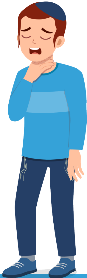
תסמיני מחלה כאב גרון