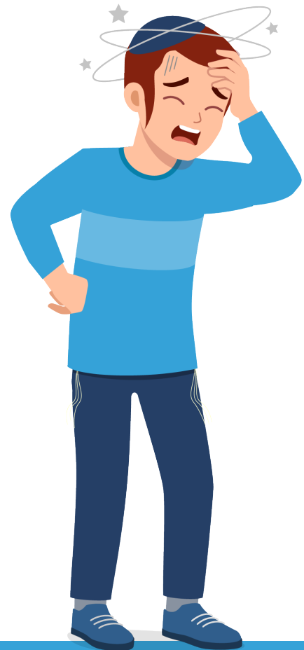
תסמיני מחלה סחרחורת