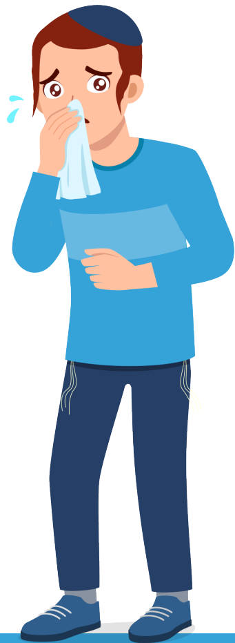
תסמיני מחלה צינון ועיטוש