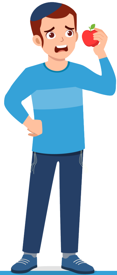
תסמיני מחלה שינויים בחוש הטעם והריח