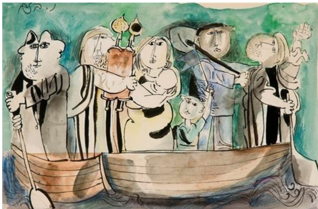
נפתלי בזם, 'מהגרים', צבעי מים [אקוורל] על נייר.