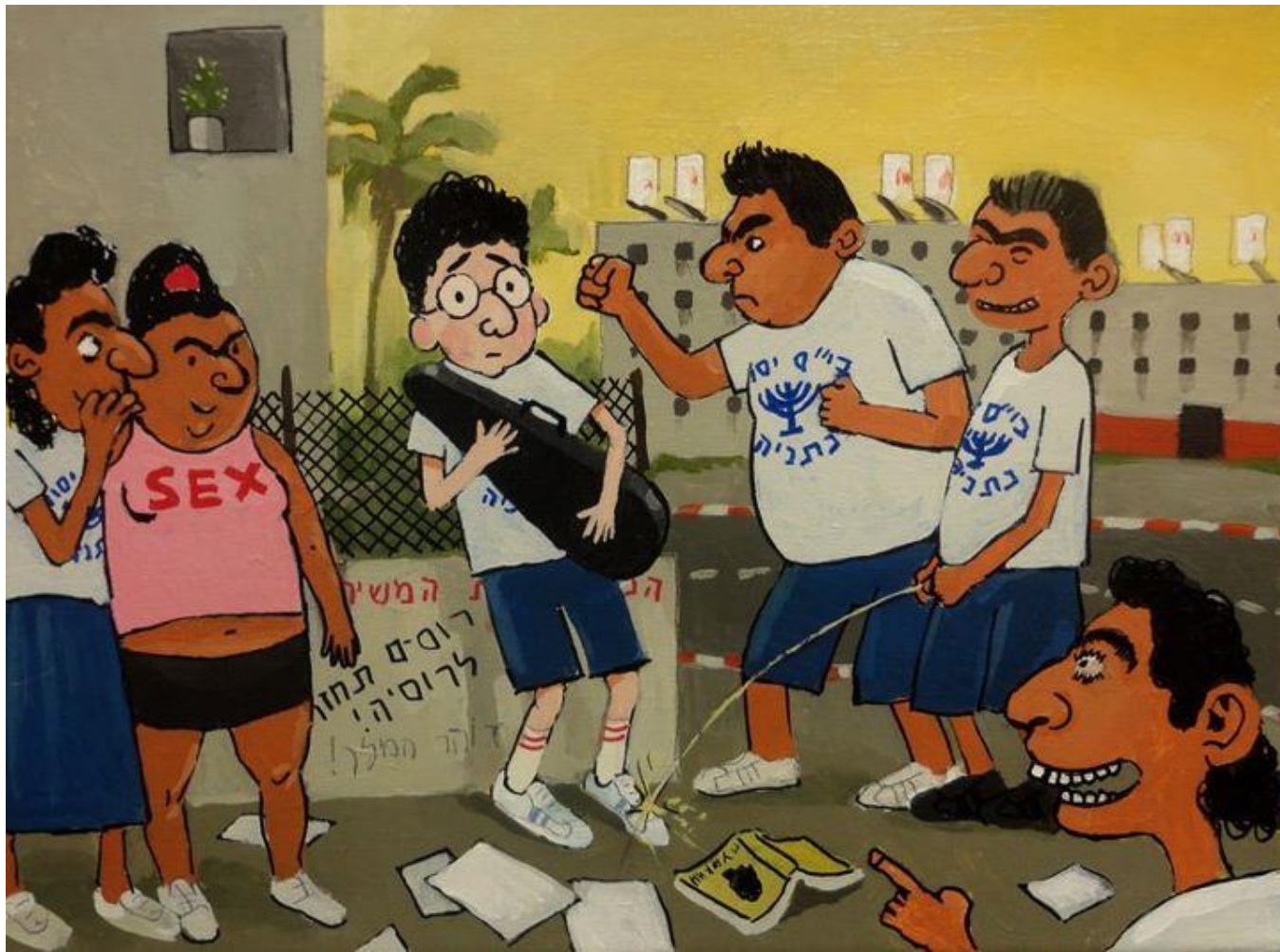
'השפלה בביה"ס', 2011, אקריליק וטושים על בד