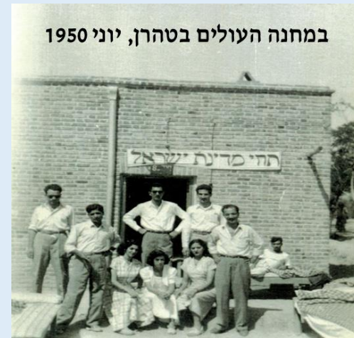
במחנה העולים בטהרון, יוני 1950