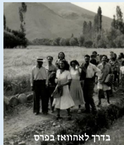
בדרך לאהוואז בפרס