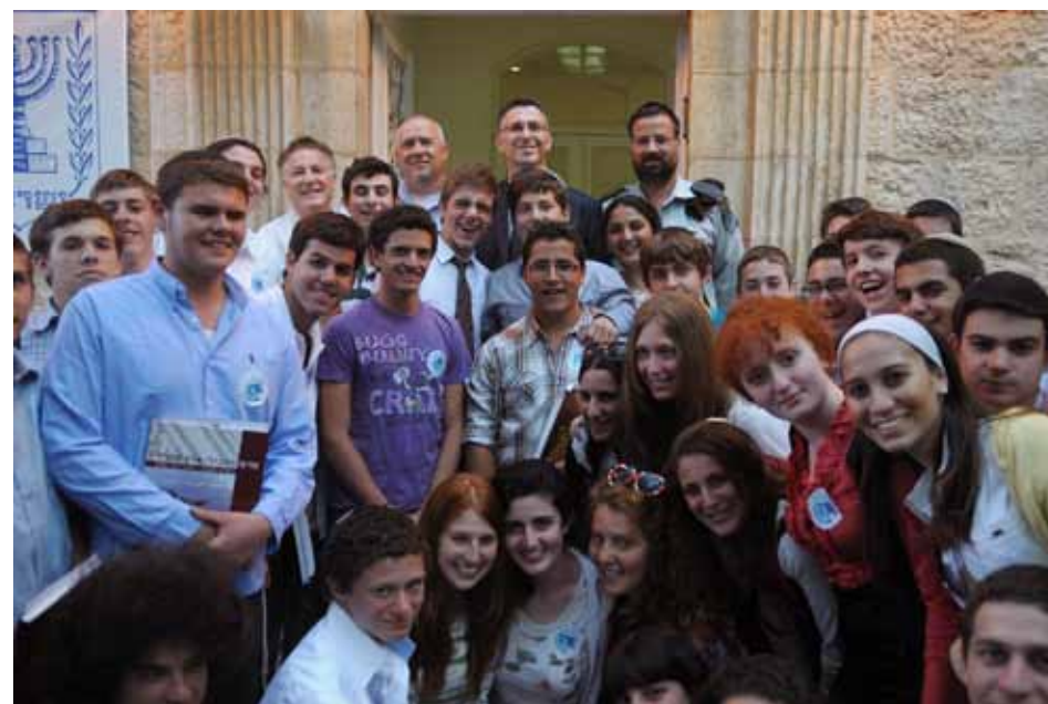
מתמודדי החידון במפגש עם שר החינוך, חר גדעון סער