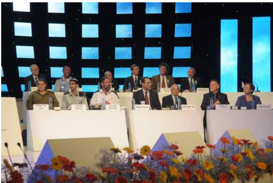
חברי הנשיאות והשופטים בחידון התני"ך