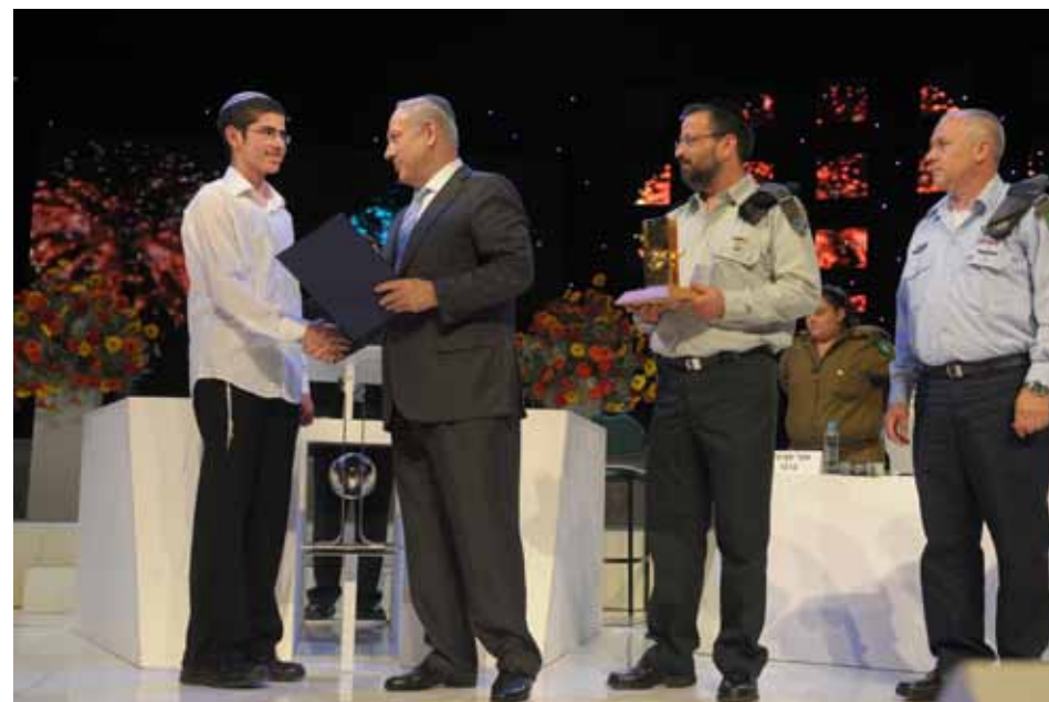
ראש הממשלה מעניק את התעודה לחתן התני"ך העולמי לשנת התשע"א