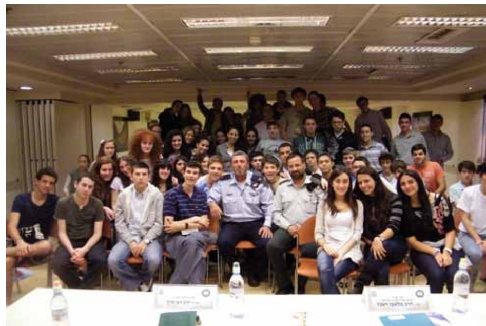
מתמודדי החידון במפגש עם הרב הראשי לצה"ל, תא"ל הרב רפי פרץ