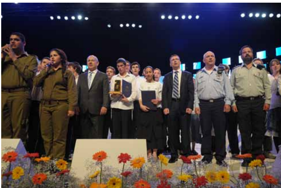
חתן התני"ך העולמי וסגניתו לצד ראש הממשלה, שר החינוך, קח"ר ומרכז החידון