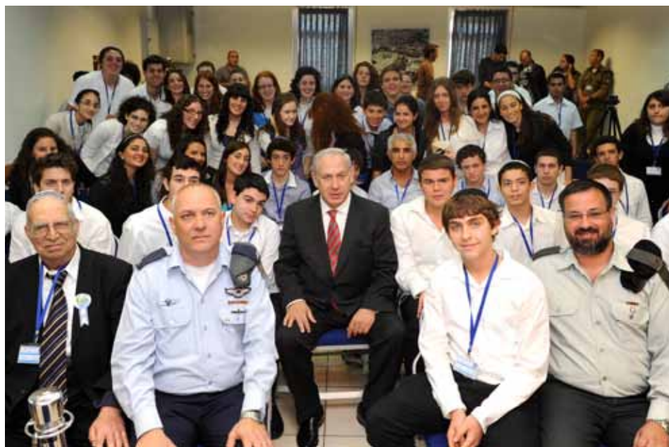
מתמודדי החרון במפגש עם ראש ממשלת ישראל, מר בנימין נתניהו