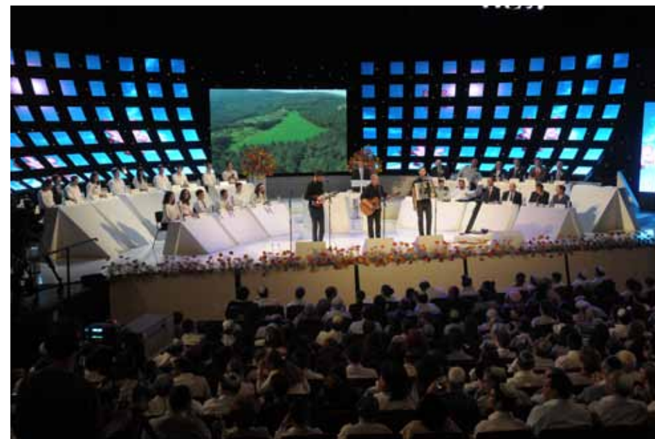
חידון התני"ך העולמי לנוער יהודי ה-48