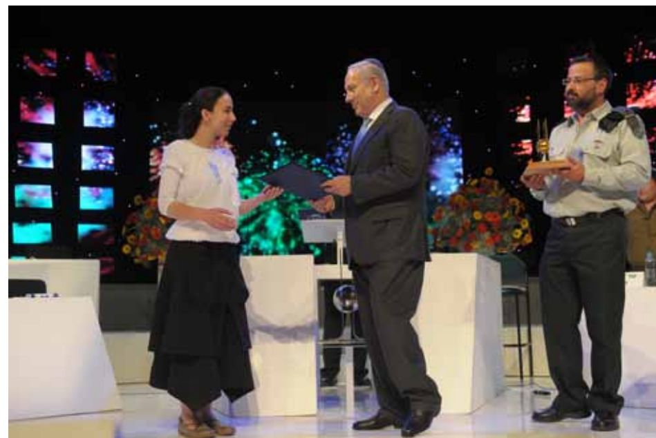
ראש הממשלה מעניק את התעודה לסגנית הראשונה לחתן התני"ך העולמי לשנת התשע"א