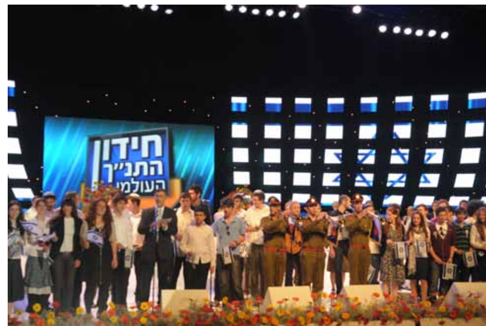
משתתפי חידון התני"ך העולמי התשע"א