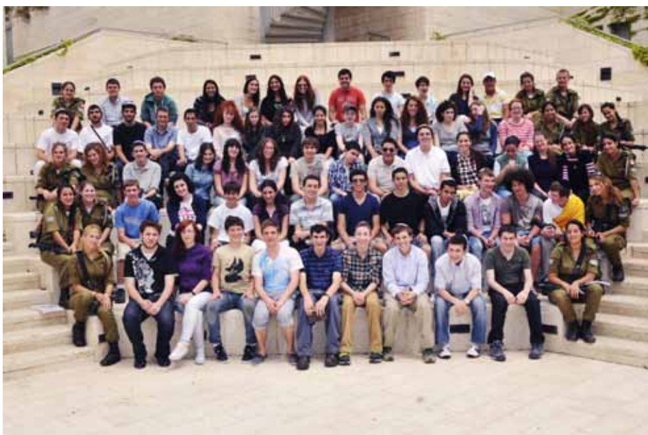
תמונה קבוצתית של משתתפי החידון וסגל חיל החינוך והנוער