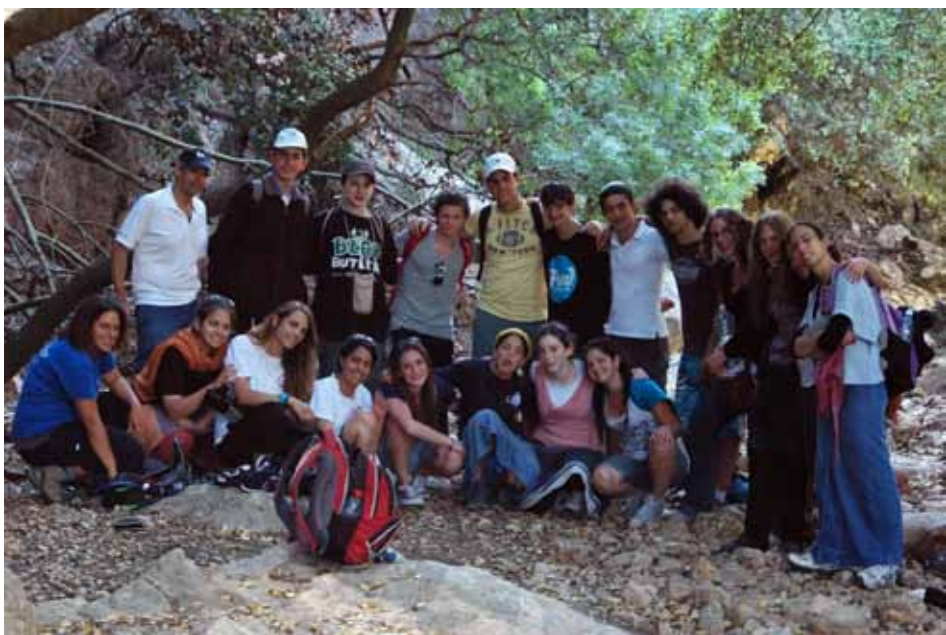
במהלך 'מסע ישראל'