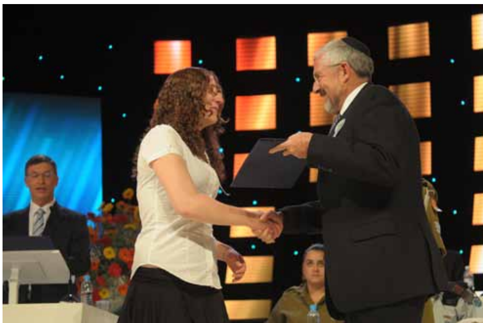
מנכ"ל הסוכנות היהודית מעניק את התעודה לכלת התני"ך לנוער יהודי בתפוצות לשנת התשע"א