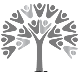
הרב רפי פרץ