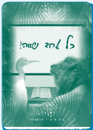
בית החינוך כמשפחה