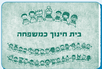
בית חינוך כמשפחה