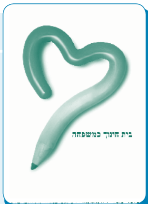
בית חינוך כמשפחה

משרד החינוך | מינהל חברה ונוער | יחידת חמ"ד | מינהל החינוך הדתי