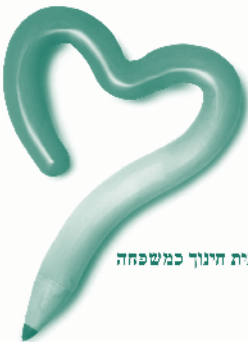
בית חינוך כמשפחה