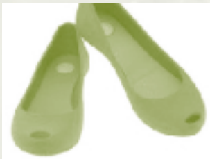
נעליים מגומי ממוחזר

כיום קיימים בשוק פריטים רבים לשימוש אישי וביתי כגון: ריצוף, טפטים, גופי תאורה, אדניות, נעליים כלים ועוד. פריטי העיצוב ה"ירוקים" נראים נקיים, חדשים, אסתטיים ומקוריים.