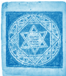
ציור קדום של מגן דוד משנת 1008 על כריכת כתב יד לנינגרד. יוצר: Shmuel Ben-Ya'aakov

המגן-דוד מורכב משני משולשים שווי צלעות המורכבים זה על גבי זה במהופך. במאה ה-19 נעשה המגן-דוד לסמל היהודי הנפוץ ביותר. התנועה הציונית הכריזה שהמגן-דוד הוא הסמל המרכזי בדגל התנועה, שנהפך לאחר מכן לסמל מדינת ישראל. בתקופת השלטון הנאצי באירופה שימש המגן-דוד כאות קלון ליהודים, והם חויבו לשאת על בגדיהם מגן דוד צהוב ובו הכתובת יהודי. כמו כן, צויר מגן-דוד על שטרות הכסף שהנאצים הוציאו לשם שימוש בגטאות.