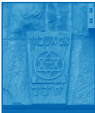
מגן דוד כעיטור מגולף באבן, מעל לכניסה למבנה מגורים משנת תרצ"ו (1936) בשכונת נחלאת שבירושלים.

המגן-דוד מורכב משני משולשים שווי צלעות המורכבים זה על גבי זה במהופך. מקורו אינו ברור. המגן-דוד, יחד עם צורה גיאומטרית דמוית כוכב בעל חמישה חודים, שנקראה חותם שלמה, היו ידועים כדוחי כוחות מזיקים. שתי הצורות מופיעות בקמעות ועל גבי קברים של עמי מזרח שונים.