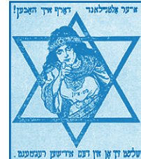
סמל הבריגדה - חטיבה יהודית לוחמת (חי"ל)