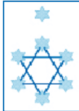
דגל שהוצע על ידי תאודור הרצל ובו שבעה כוכבי זהב בצורת מגן-דוד