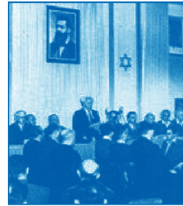
בן גוריון מכריז על הקמת המדינה. תל אביב 14 במאי 1948 - ה' באייר תש"ח