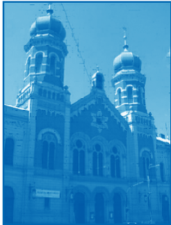
מגן-דוד בחזית בית הכנסת של פילזן, בוהמיה, צ'כיה

המגן-דוד מורכב משני משולשים שווי צלעות המורכבים זה על גבי זה במהופך. השם "מגן-דוד" מוזכר לראשונה בתלמוד הבבלי כשם של ברכה "ברוך אתה ה' מגן-דוד" (פסחים ק"ז, ע"ב). ברכה זו נאמרת בבית הכנסת, בתור קמע. על פי המסורת היהודית, דוד המלך נשא על מגינו סמל של מגן-דוד. בתורת הקבלה נחשב סמל המגן-דוד כסמל לגאולה, אשר תגיע באמצעות משיח מצאצאי דוד המלך. משיח השקר שבתאי צבי (1626-1676) אימץ את המגן-דוד והשתמש בו כסמל ל"משיחיותו".