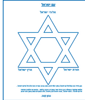
שלושת קדקודי המשולש במגן הדוד, אשר מחוברים ביניהם בצלעות, מהווים את שלושת יסודותיו של עם ישראל: אלוהי ישראל, תורת ישראל וארץ ישראל. נוצר על ידי: נבון קצב

המגן-דוד מורכב משני משולשים שווי צלעות המורכבים זה על גבי זה במהופך. במאה ה-19 נעשה המגן-דוד לסמל היהודי הנפוץ ביותר. התנועה הציונית הכריזה שהמגן-דוד הוא הסמל המרכזי בדגל התנועה, שנהפך לאחר מכן לסמל מדינת ישראל. בתקופת השלטון הנאצי באירופה שימש המגן-דוד כאות קלון ליהודים, והם חויבו לשאת על בגדיהם מגן דוד צהוב ובו הכתובת יהודי. כמו כן, צויר מגן-דוד על שטרות הכסף שהנאצים הוציאו לשם שימוש בגטאות.