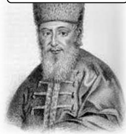
רבי יחזקאל לנדא

1- אין איסור צער בעלי חיים בהמתה: הרב אבינר מבסס את פסיקתו על בסיס שאלה שנשלחה ל רב יחזקאל לנדא (הנודע ביהודה) . הרב נשא האם מותר _____ . השואל מציין שהוא מודע לכך שייתכן והדבר אסור בגלל 2 איסורים: