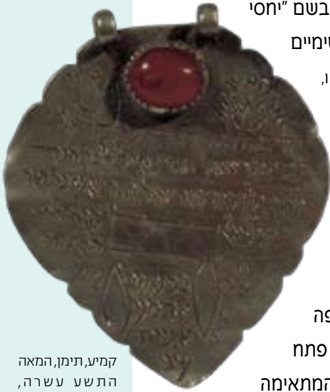
קמיע, תימן, המאה התשע עשרה, כסף ואבן, אוסף מוזיאון וולפסון, היכל שלמה.

"והיה מחניך קדוש ולא יראה בך ערות דבר" (דברים כג, טו), ערות דיבור. ר' שמואל בר נחמני אמר: זה ניבול פה.