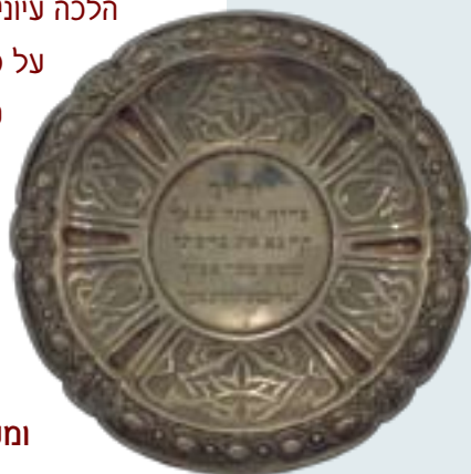
צלחת, כסף, אוסף מקט גרונד, מוזיאון וולפסון, היכל שלמה

אם חסר אחד מכל אלה, ובייחוד אם אין הסכמה בין האב לבין האם ואין הם מחנכים בכיוון אחד, הרי קלקלת הילד עדיין איננה מוכיחה את ההשחתה המוסרית של טבעו. אילו נתחנך כהלכה על ידי אביו ואמו, אפשר שהיה מתפתח בדרך אחרת. ומה שעָמַת בידי ההורים יכול לתקון (=להיות מתוקן) על ידי החיים והניסיון. ההסכמה הגמורה בין האב לבין האם היא התנאי הקודם לכל האמור כאן.