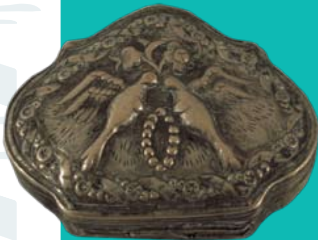
קופסא לתכשיט, בוכארה, כסף, אוסף מוזיאון וולפסון, היכל שלמה