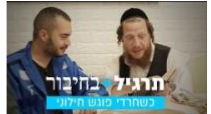
למה אני צריך לממן אותך?