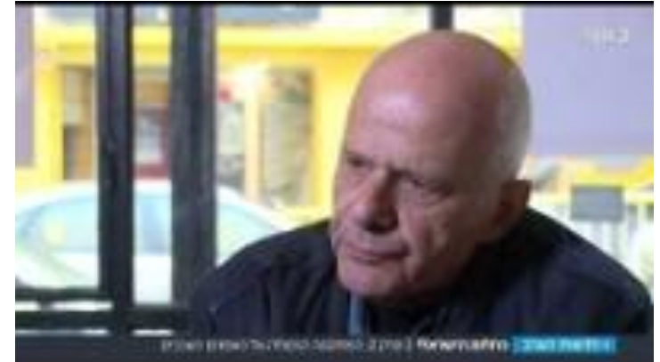
אמנים ערבים מרגישים מותקפים