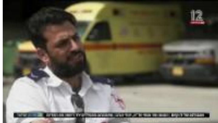
אמבולנס של דו-קיום