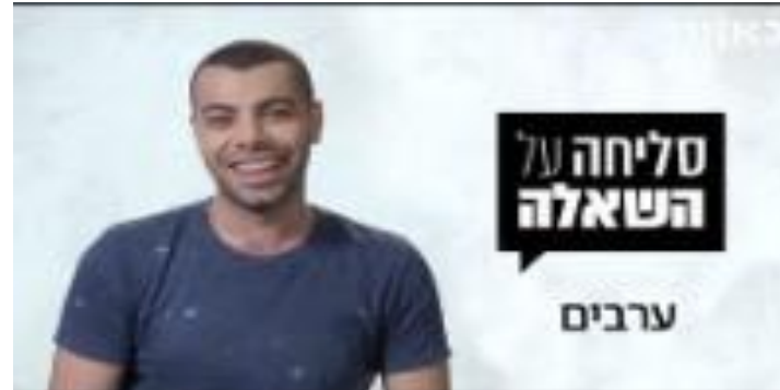
סליחה על השאלה - ערבים