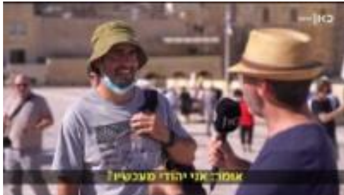
מי קובע מיהו יהודי?