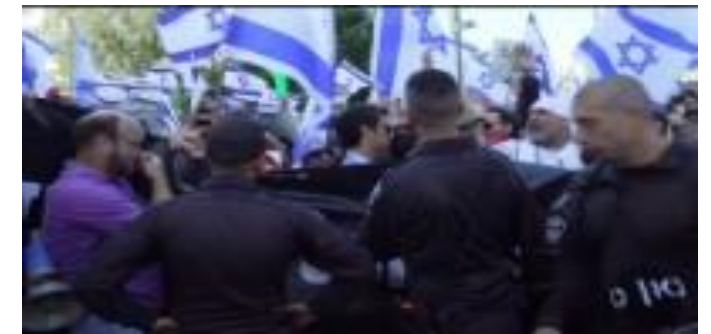
אלימות בין אזרחים