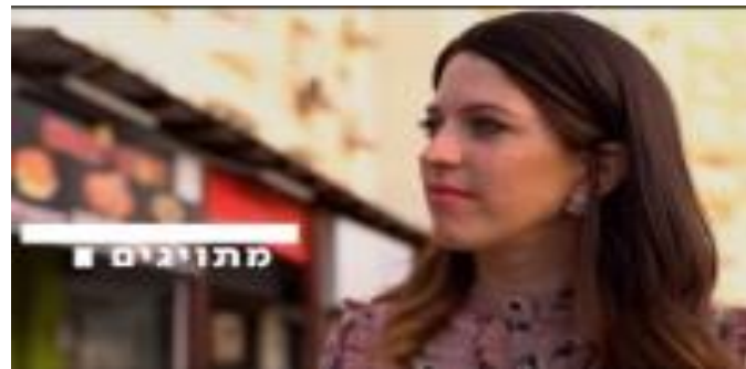
מה חושבים חילונים על חרדים?