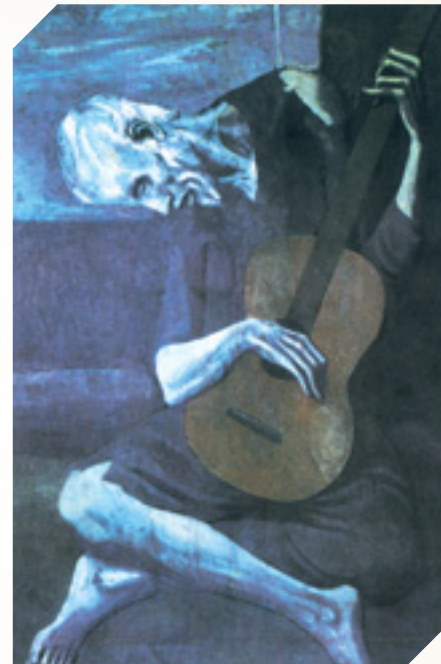
פבלו פיקאסו - המנגן העיוור, 1903

מתוך ספר השירים "להיות כלואה בגופי", עמ' 37