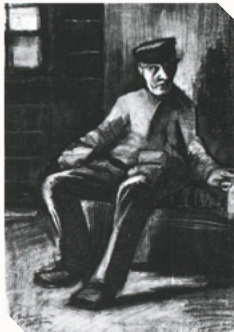
ויסנט ואן גוך - אדם עיוור יושב בחדר, 1883

המשורר, ארז ביטון , נפצע בילדותו מרימון שמצא והתפוצץ בידו. הפיצוץ גרם לעיוורונו ולקטיעת ידו השמאלית.