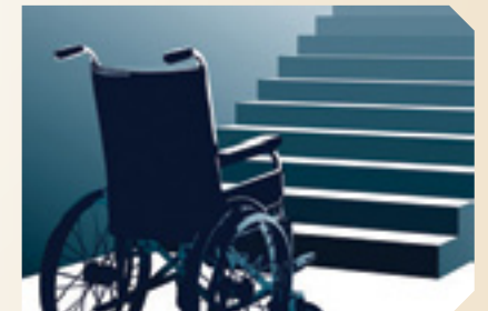
דיור ציבורי-תחזוקת דירה מותאמת לאנשים עם מוגבלויות.