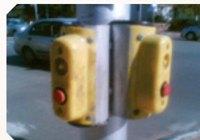
מתקן המאפשר לעיוורים להשתמש ברמזור להולכי רגל, בהשמעת קול שונה בהתאם לצבע הרמזור.

לאזור המתקרות, מה צורך ניתן לצוות, להצטבם, כדי ליישם את חוק סווייז ככונות לאנשים צמ מוגבלויות? נתיק