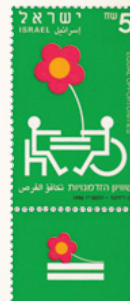
שוויון הזדמנויות לאנשים עם נכות, 1996. מעצב: דן רייזינגר