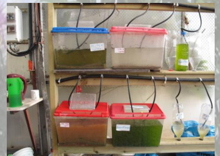
"תמציטבע" – מערכות אקולוגיות מימיות

תוכניות התפתחות וצמיחה: הקמה של מערכת בת-קיימא המתפקדת כראוי, שיקום והחייאה של צמחים קיימים וייצור דור חדש ואיכותי של צמחים למטרות מאכל ומחקר כאחד. הפיכתה של החממה ללב ירוק בבית הספר ויצירת מודעות אצל כל התלמידים שהחממה שלהם ושהם מוזמנים להשתתף בפעילות השוטפת וליצור משהו משלהם.