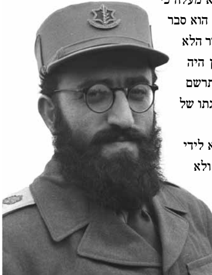
הרב הצבאי הראשי שלמה גורן, 1 במרס 1949

באותה עת עדיין נשא הרב גורן את השם גורונצ'יק, אך לדבריו במהלך פגישתם הציע לו בן-גוריון להחליף את שמו לגורן בהתאם למדיניותו לחייב בעלי תפקידים ציבוריים להחליף את שמם לשם עברי. 20 לימים העניק הרב גורן לשמו משמעות דתית וראה בו תרגום של המילה הארמית אירא, דהיינו גורן, המופיעה בשמו של אחד מחלקי ספר ה'זוהר', 'אירא רבא', שבו מתוארת התכנסות תלמידיו של ר' שמעון בר יוחאי לביתו ללימוד תורת הנסתר. 21