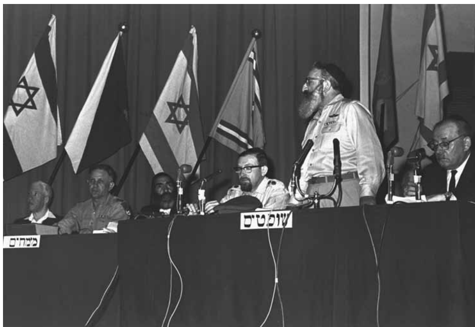
הרב גורן בראש השופטים בגמר חידון התנ"ך של צה"ל, 20 במאי 1966

שיש לומר 'זכור אלוהים' – ולא 'זכור עם ישראל' כבנוסח שתיקן ברל כצנלסון – התבטא בן-גוריון: 'מי שאומר שאיננו מאמין באלוהים, או שהוא שוטה או שהוא שקרן. כי אינני חושב שאפשר להוכיח שאין אלוהים'. בן-גוריון האמין אף הוא כי עם ישראל הוא עם סגולה, וכי נדרש ממנו יותר מאשר מעמים אחרים בתחום הרוחני והמוסרי. עם זאת הוא כפר במושג אלוהי ישראל, וסבר כי אלוהים הוא אוניוורסלי ולא בחר בישראל, אלא ישראל בחרו בו. 93