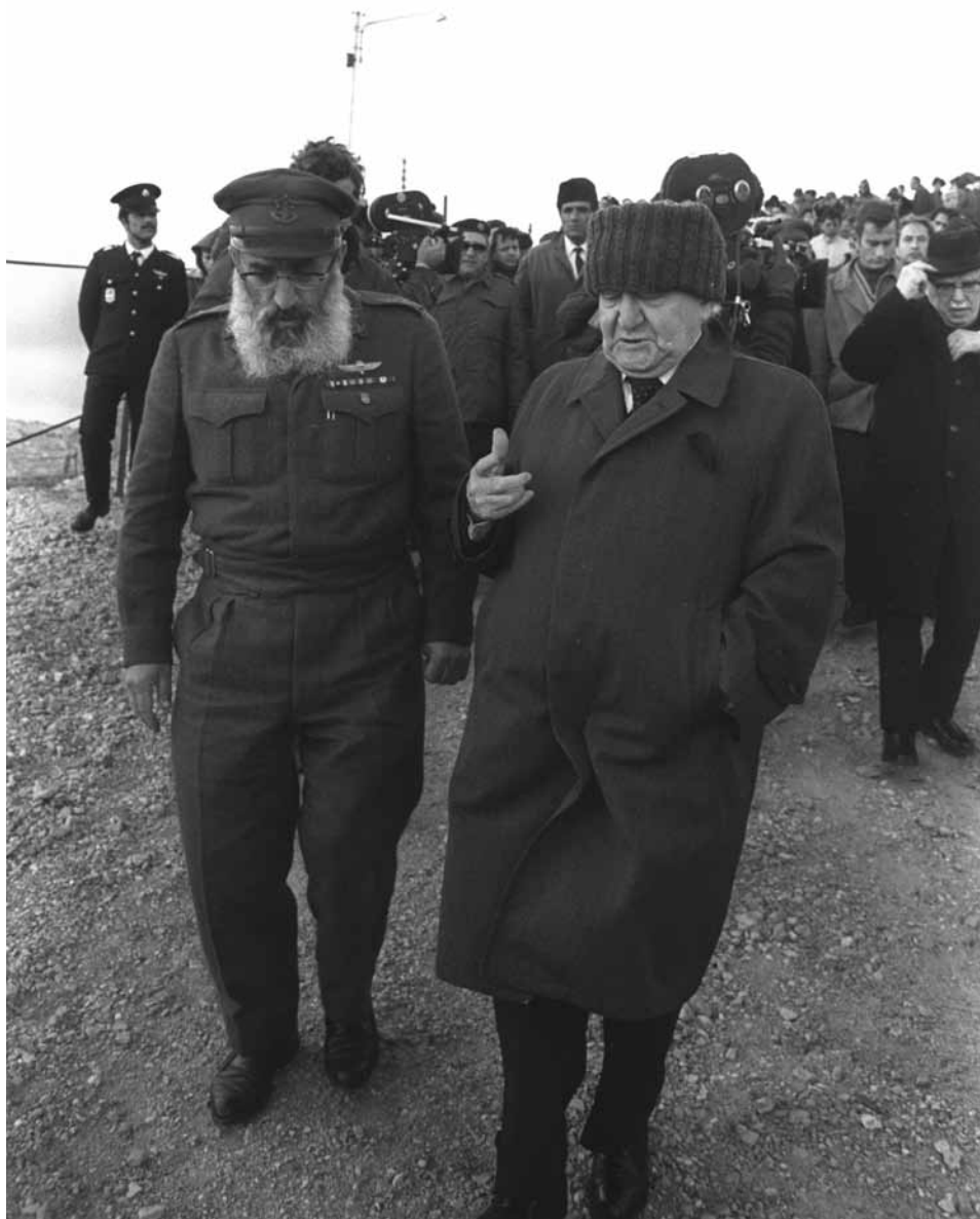
דוד בן-גוריון ושלמה גורן בהלווית ש"י עגנון, 18 בפברואר 1970

הרב גורן כינה את בן-גוריון בתקופה זו 'דידי זה עשרות בשנים, ודידי כל בית ישראל, האיש היקר ביותר לעם היהודי'. 135