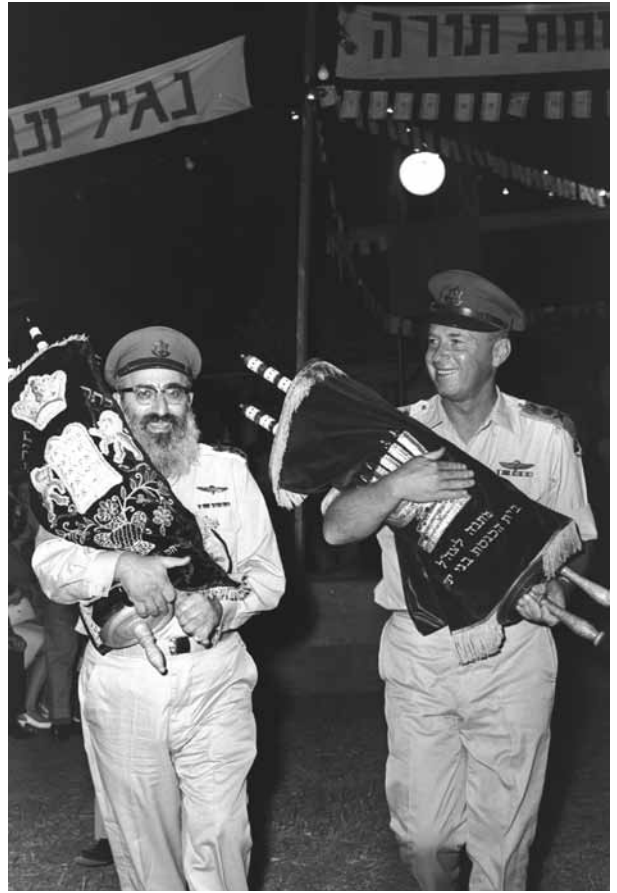
הֶרֶמְטִיכ״ל יִצְחָק רִבִּין וְהֶרֶב שְׁלֵמָה גּוֹרֵן נוֹשָׂאִים סְפָרֵי תוֹרָה בְּחַגִּיגַת שְׁמַחַת תּוֹרָה, 6 בְּאוֹקְטוֹבֵר 1966

מִלְבַד יַחְסֵי הַגּוֹמְלִין שֶׁשָּׂרְרוּ בֵּין הַשְּׁנַיִם עַל רַקַע עֲבוּדָתָם הַבִּיטְחוֹנִית, הֵם שִׁיתְפוּ פְּעוּלָה בְּעִנְיֵינִים אֲזֵרְחִיִּים שׁוֹנִים. הֶרֶב גּוֹרֵן נִשְׁלַח בְּאוֹתָן שְׁנַיִם מִטַּעַם מוֹסְדוֹת הַמְּדִינָה לְבַקֵּר בַּקְהִילוֹת יְהוּדִיּוֹת בְּרַחֲבֵי הָעוֹלָם לְשֵׁם גִּיוּס כִּסְפִים וְחִיּוּזֵק הַקָּשֶׁר בֵּין קְהִילוֹת אֵלוֹ לְיִשְׂרָאֵל. בְּשׁוֹבוֹ הוּא נִהַג לְדוּחַ לְבֶן-גּוֹרִיוֹן עַל תּוֹצְאוֹת הַבִּיקוּרִים וְעַל מִצַּב הַקְהִילוֹת, וְלַעֲתִים אִף הַעֲבִיר לוֹ מִסְרִים מְדִינִיִּים מִמְּנַהִיגִים שֶׁעִמָּם נִפְגַּשׁ. 79 לְדוּגְמָה בִּשְׁנַת 1963 דִּיוּחַ הֶרֶב גּוֹרֵן לְבֶן-גּוֹרִיוֹן בְּרֵאגָה עַל הַתְּחֻזָּקוֹת הַסְּטוּדֵנְטִים הָעֵרֻכִים בְּקַמְפּוּסִים בְּרַחֲבֵי הָעוֹלָם, וְעַל הַיַּעֲדָר מַעֲנָה מִצֵּד הַסְּטוּדֵנְטִים הַיְהוּדִים לְטַעֲנוֹת שֶׁהִפְנוּ כְּלִפֵּי יִשְׂרָאֵל, וְהִצִּיעַ לְהַקִּים מוֹסְדוֹת אֲשֶׁר יִסְיְעוּ לְסְטוּדֵנְטִים בְּהַסְבַּרְת עֲמֵדַת יִשְׂרָאֵל בְּעוֹלָם. 80 לְאַחַר שׁוֹבוֹ שֶׁל הֶרֶב גּוֹרֵן מִבִּיקוּר בְּמַקְסִיקוֹ בִּשְׁנַת 1964 שׁוֹחַח עִמּוֹ בֶּן-גּוֹרִיוֹן עַל אִפְשָׁרוֹת הַיִּמְצָאוֹת שֶׁל 'אִינְדִיאָנִים יְהוּדִים' בְּאֲזוֹר זֶה. 81 הֶרֶב גּוֹרֵן אִף הִיָּה אֶחָד מִחֲכֵמֵי יִשְׂרָאֵל שְׁאֵלֵיהֶם פָּנָה בֶּן-גּוֹרִיוֹן בְּשֵׁאלַת 'מִיְהוּ יְהוּדִי' בְּעַקְבוֹת הַמִּשְׁבָּר שֶׁפָּרַץ סָבִיב סוּגִיָּה זֹו בִּשְׁנַת 1958. 82