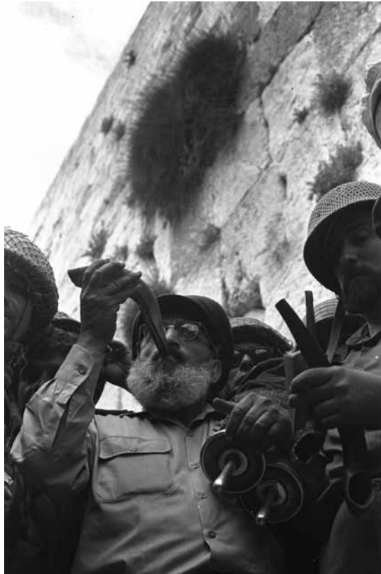
הרב הצבאי הראשי, האלוף גורן, תוקע בשופר עם כיבוש הכותל המערבי, 7.6.1967

נבואתו של יחזקאל להתגשם, בהתקדש שם שמים ושם ישראל לעיני עמים רבים בעולם, ובהקבץ נדחי ישראל [...] היתה בזה משום אתחלתא של תהליך הגאולה, עד אשר נזכה לגאולה השלמה במהרה בימינו. 27