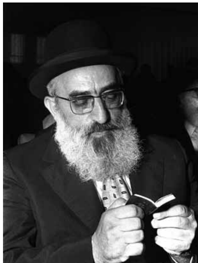
הרב הראשי האשכנזי לישראל שלמה גורן, 15.10.1972