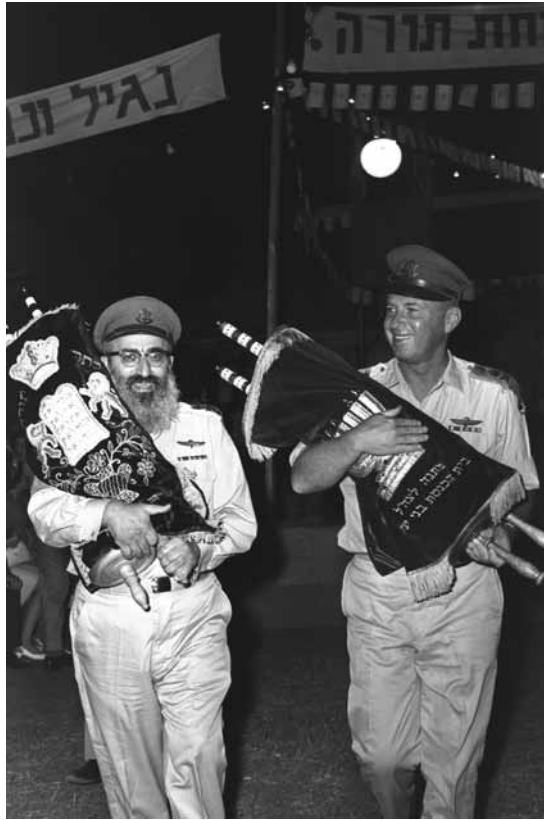
הרמטכ"ל, יצחק רבין, והרב הצבאי הראשי, האלוף שלמה גורן, בחגיגות שמחת תורה באחד מבסיסי צה"ל, 6.10.1966

הנובעים מבחירת העם. הוא הדגיש שהמשטר על פי תורת ישראל אינו תיאוקרטיה במושגי העת העתיקה וימי הביניים, משום שחוקי התורה אוסרים שליטת כוהנים על העם ומחייבים הפרדה בין כוהני הדת ובין השלטון – המלך. עם זאת חוקי התורה מחייבים את השלטון, אך משמשים רק מעין חוקת יסוד אשר מלכדה קיימת גם מערכת חוקים בתחום משפט המלוכה שנחקקה על ידי השלטון אשר קיבל את סמכותו מהעם. כך נהוג גם במדינות דמוקרטיות אשר מכוח חוקי המוסר הטבעי קיבלו עליהן חוקי יסוד בלתי משתנים. 22