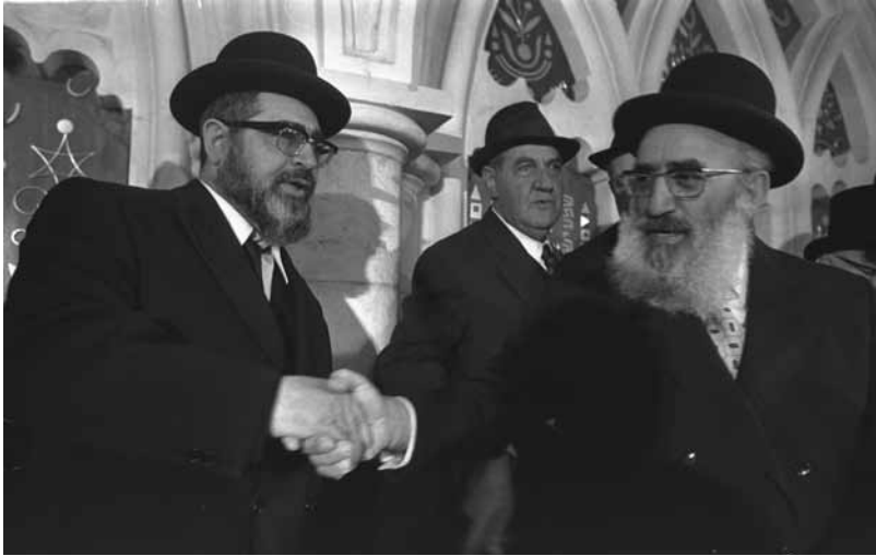
הרב עובדיה יוסף והרב שלמה גורן מגיעים לטקס מינויו של הרב יוסף לרב הראשי הספרדי הראשון לציון, 26.3.1974

הנראה לאזן את כוחה הפוליטי העולה של ההנהגה החרדית ולהציב לה אלטרנטיבה ציונית ברורה ומובהקת. זו גם הסיבה, ככל הנראה, להתקרבותו להנהגה הפוליטית של המפד"ל ולרבנים ציונים. 81 בעת מאבקיו של הרב גורן בנושא זה, כמו גם בנושאים אחרים, עמד לימינו הרב צבי יהודה קוק, מנהיגה הרוחני הבולט של הציונות הדתית. לשאלת תלמידיו, אשר תמחו על עמדת הרב גורן בעניין תפילות יום העצמאות השונה מעמדת הרבנים הראשיים שקדמו לו, קבע הרב קוק שיש לסמוך על פסיקותיו של הרב גורן בענייני ציבור, ובהם גם בעניין אמירת 'הלל' בברכה ביום העצמאות. 82