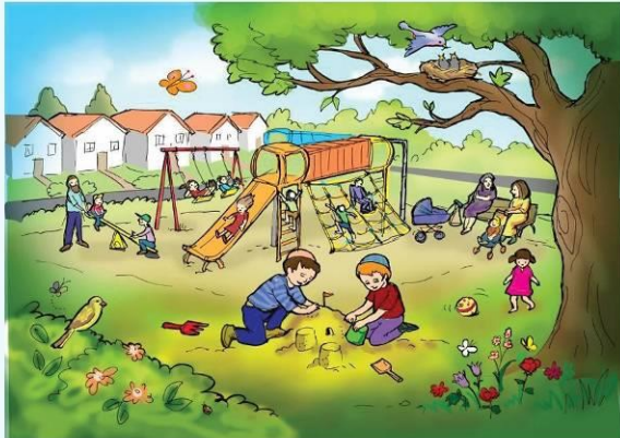
כרטיסיית ציור 2

משימה: רשמו 7 דברים טובים המופיעים בציור.