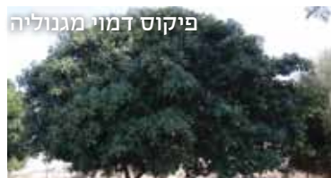
פיקוס דמוי מגנוליה