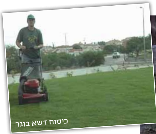
כיסוח דשא בוגר