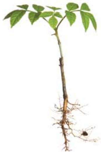
שתיל חשוף שורשים