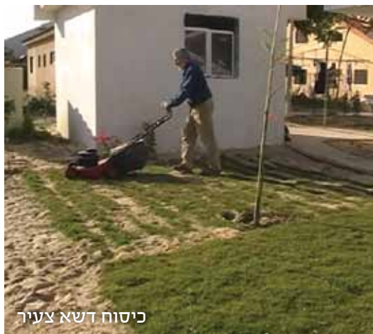
כיסוח דשא צעיר