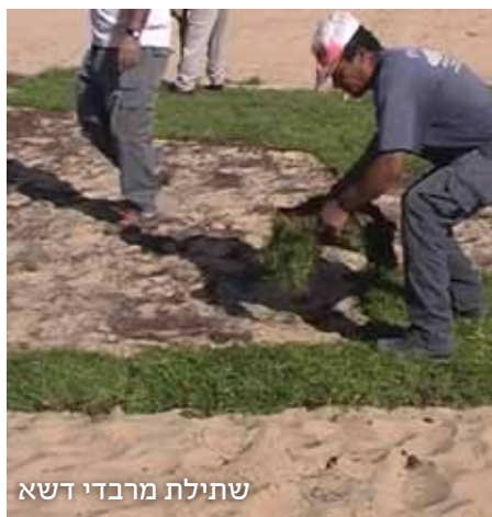
שתילת מרבדי דשא