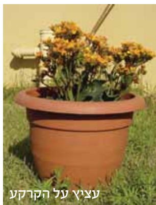
עציץ על הקרקע