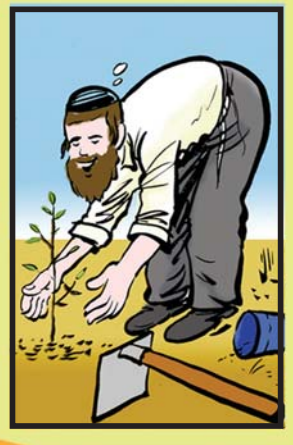
נטיעה - שתילת שתיל או יחור (ענף שניטל מעץ) באדמה.