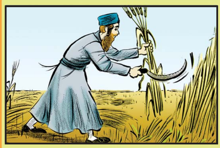
קצירה - קטיפת פרי וירק ממקום גידולם.