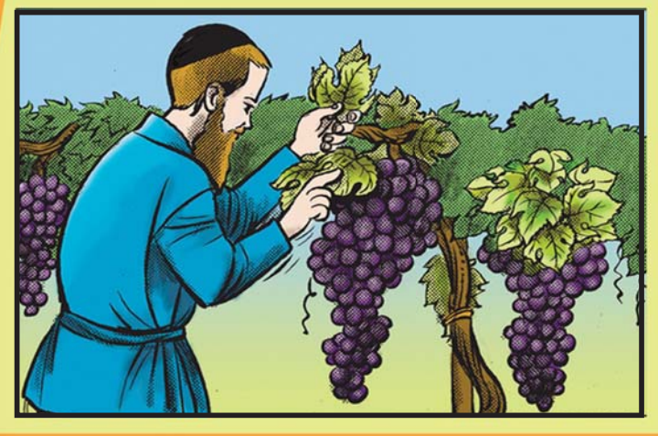
זמירה - קציצת זמורות על מנת להשביח את תנובת העץ.

כִּי תֵבֹאוּ אֶל הָאָרֶץ אֲשֶׁר אֲנִי נֹתֵן לָכֶם, וְשַׁבְּתָה הָאָרֶץ שִׁבְתָּ לָּהּ. שֵׁשׁ שָׁנִים תִּזְרַע שָׂדֶךְ וְשֵׁשׁ שָׁנִים תִּזְמַר כְּרֶמֶךְ, וְאִסַּפְתָּ אֶת תְּבוּאָתָהּ. וּבַשָּׁנָה הַשְּׁבִיעִית שַׁבְּתָה שַׁבְּתוֹן יִהְיֶה לְאָרֶץ שַׁבְּתָ לָּהּ, שָׂדֶךְ לֹא תִזְרַע וְכֶרֶם לֹא תִזְמַר. אֶת סְפִיחַ קִצְיֹרֶךְ לֹא תִקְצַר וְאֶת עֵנְבֵי נִזְיֹרֶךְ לֹא תִבְצַר, שְׁנַת שַׁבְּתוֹן יִהְיֶה לְאָרֶץ. (ויקרא כ"ה)