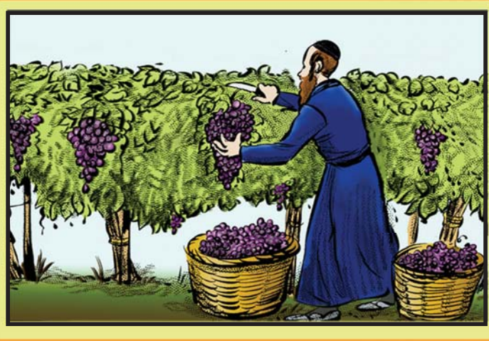
בצירה - קטיפת ענבים מן הגפן.