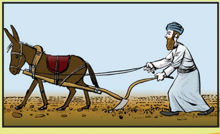
חרישה - פילוח האדמה על מנת להכשיר את הקרקע לזריעה.

מלאכות האסורות מן התורה אסור לעשותן אמילו כדי לשמור על קיום האילן (לאוקמי-לקיים את הצמח שלא ימות)