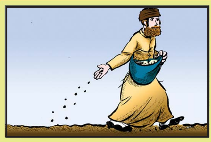
זריעה - הטמנת זרעים באדמה לשם גידול צמחים.