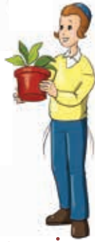
עֲצִיץ שְׂאִינוֹ נָקוּב