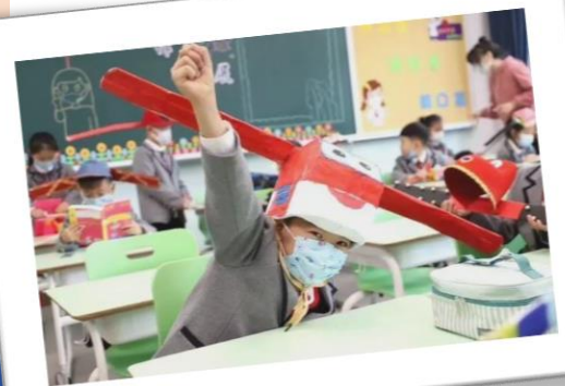
חזרה ללימודים בעיר חאנגג'ואו בסין, כיתה א'. קיבלו הוראה לבוא עם קובע שמודד מרחק של מטר מכל כיוון

צוות הכותבים הינם אנשי אקדמיה, בכירים בתעשייה וכלכלה, מערכת הבריאות, תחבורה, תיירות ועוד