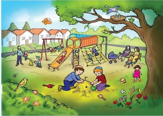
כרטיסיית ציור 2

משימה: רשמו 7 דברים טובים המופיעים בציור.