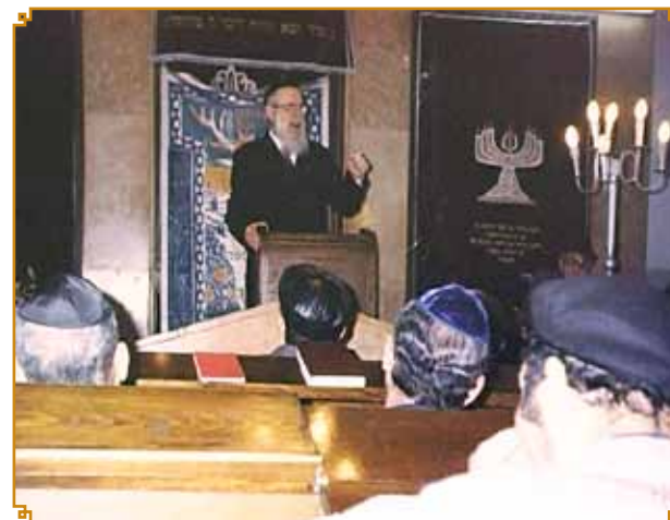
הרב מעביר שיעור בבית הכנסת "אוהל מועד"

תשל"ה (1975): הוציא לאור את ספרו "קיצור שולחן ערוך - מקור חיים", שבו הוא ליקט בקצרה את ההלכות מתוך ספריו "מקור חיים השלם". בשל סגנונו המיוחד והיקפו, ספר זה התקבל במערכת החינוך הדתי כספר הלימוד בהלכה.