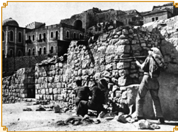
חיילי הליגיון הירדני יורים אל עבר ישיבת "פורת יוסף" שברובע היהודי, - (תש"ח).