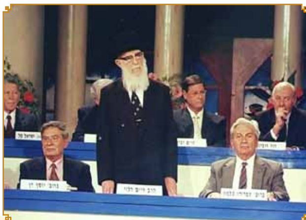
טקס הענקת פרס ישראל תשנ"ז