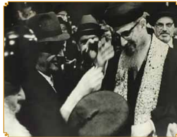
הכתרת הרב לרבה הראשי של העיר תל אביב