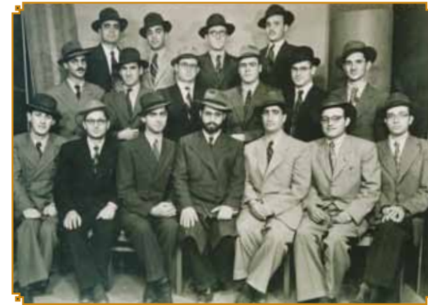
תלמידי ישיבת פורת יוסף נפרדים מחברם הרב עובדיה יוסף לפני צאתו לשליחות במצרים. הרב חיים דוד הלוי יושב קיצוני משמאל.

בשנת תרצ"ג (1933), בהיותו בן תשע, החל ללמוד בישיבת "פורת יוסף" בעיר העתיקה, שם למד עד אמצע שנות העשרים לחייו. היה תלמיד שקדן ומצטיין.