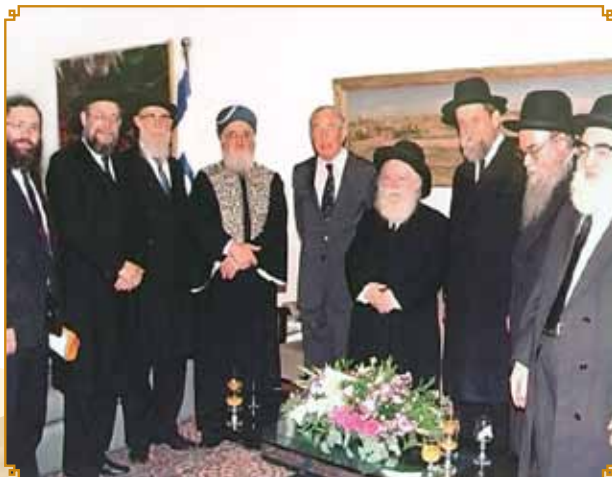
חברי מועצת הרבנות הראשית עם הנשיא חיים הרצוג

ראשון לציון ובמושבים הסמוכים לה, כל זאת כדי להשפיע על ההורים ולשכנע אותם לשלוח את ילדיהם לחינוך דתי.