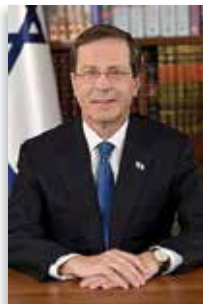
יצחק הרצוג נשיא המדינה האחד עשר

לרב יצחק אייזיק ולרבנית שרה נולדו שני בנים. בשנת תרע”ח (1918) נולד חיים, והוא צמח להיות איש צבא, פוליטיקאי, עורך דין וסופר ישראלי, ולימים לנשיאה השישי של מדינת ישראל. בשנת תרפ”ב (1921) נולד יעקב דוד, והוא גדל להיות משפטן ודיפלומט ישראלי, ולימים שימש מנכ”ל משרד ראש הממשלה של לוי אשכול וגולדה מאיר. נכדם של הרב והרבנית הוא יצחק הרצוג, ששימש יושב ראש הסוכנות היהודית, ראש האופוזיציה, שר וחבר כנסת, ובימים אלו מכהן כנשיא המדינה האחד עשר.