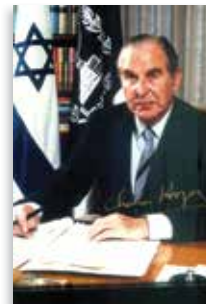
חיים הרצוג נשיא המדינה השישי