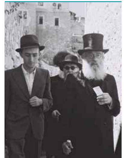
הרב הרצוג בסמטאות העיר העתיקה של ירושלים, תש"ז

הרב ראה מזיגה רבת קסם בשילוב שבין ארץ ישראל, עם ישראל ותורת ישראל. לפיכך, מוטלת אחריות גדולה על ההורים, ועל כל גנת, מחנך ומחנכת, להגדיל את קרן התורה, ללמד אמונה ולחנך לקיום מצוות ולאהבת ארץ ישראל בגנים ובבתי הספר, וכל זאת כדי לקרב את הילדים כבר בבסיס חינוכם למקור מחבתם.