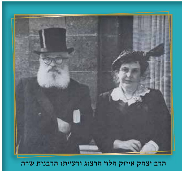
הרב יצחק אייזיק הלוי הרצוג ורעייתו הרבנית שרה