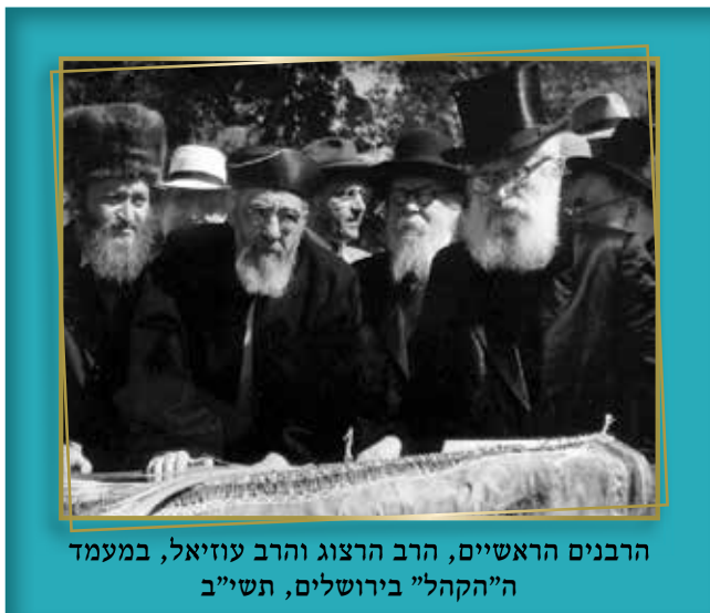
הרבנים הראשיים, הרב הרצוג והרב עוזיאל, במעמד ה”הקהל” בירושלים, תשי”ב

מיום זה ועד יום פטירתו פעל רבות לביצור מעמדה של הרבנות הראשית, להאדרת לימוד התורה בארץ, להרחבת סמכות בתי הדין הרבניים ולהרמת קרנם של מוסדות התורה והדת ברחבי הארץ. היה לרב קשר מיוחד עם שלטונות המנדט בארץ, שהעריכו אותו מאוד, והוא ניצל את הקשר הזה למען הכלל והפרט.