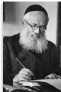
הר”י יצחק אייזיק הלוי הרצוג הרב הראשי לישראל