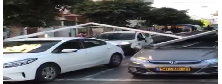
קריסת קונסטרוקציה לתליית הגברה ותאורה