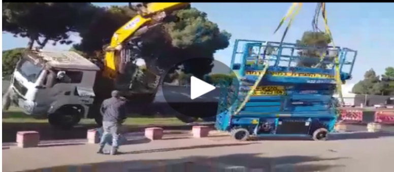
התהפכות משאית בעת פריקת במה