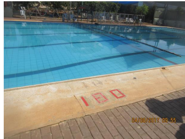
האזור ממנו הוצאה התלמידה מהמים

במהלך הרחצה היו שלושה תלמידים במים. כשהצוות החינוכי התחיל בהוצאת התלמידים מהבריכה, אחת התלמידות ביקשה להשאר בבריכה עד ששאר התלמידים יצאו. המורה נעתרה לבקשת התלמידה והפנתה את גבה בכדי להוציא את שאר התלמידים מהמים. כשפנתה המורה להוציא את התלמידה, גילתה שמורה מקבוצה אחרת משה אותה מהמים כשהיא מחוסרת הכרה. בוצעו בה פעולות החייאה על ידי צוות חירום מד"א שהוזעק למקום, אך לבסוף נקבע מותה.