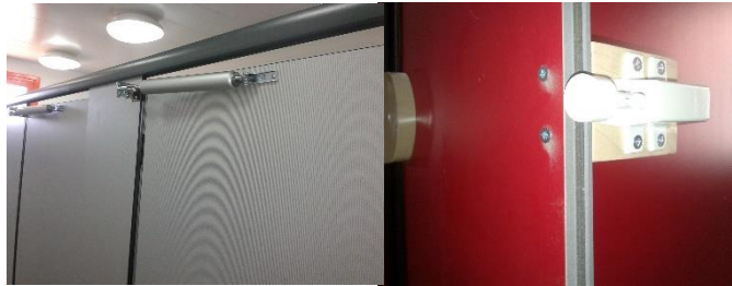
בולמים ומאיטי טריקה של דלתות שירותים