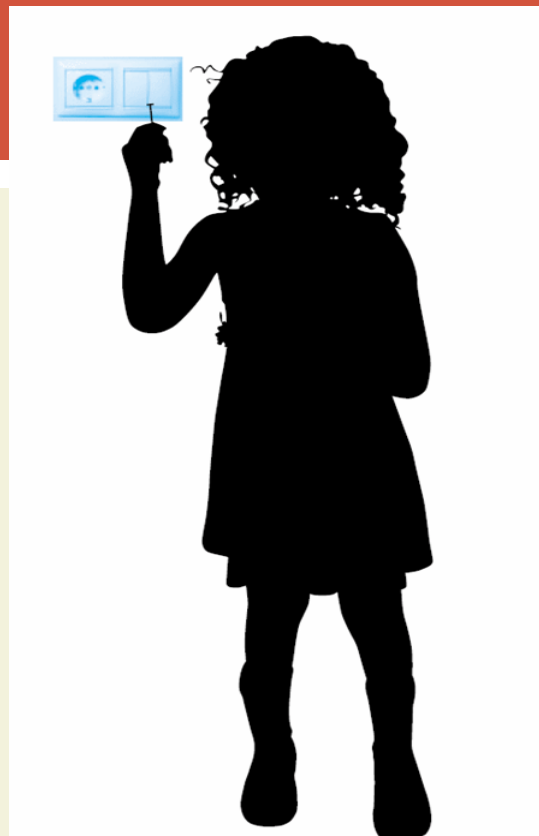
ילדה מכניסה מסמר לתקע חשמל