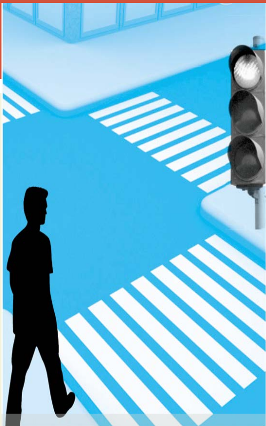
ילד עובר ברמזור אדום