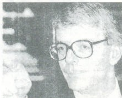
מה שמו ומה תפקידו?

אפשר לגוון את התירגול גם על-ידי חידון תמונות: