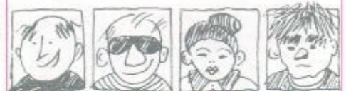
* על-פי שיעור של מירה, אילפן עציון, ירושלים, כסדרת השיעורים בווידיאו.

שאלות נכון / לא נכון: שאלות מידע (מה, מי, מתי, איפה); מבחן רב-ברירה לבדיקת הבנה; לתת לתלמידים חצאי משפטים בשני טורים - ולבקשם לקשר בין שני החצאים המשלימים זה את זה (באמצעות קו); לבקשם לערוך משפטים המופיעים בידעה/כתבה ברצף כרונולוגי נכון (ולא דווקא לפי סנסציוניות, חידוש וכו', שהם הקריטריונים העיתונאיים להקדמת משפט בידעה); לבקש לכתוב את הרעיון העיקרי בכתבה (או להציע לתלמידים כמה אפשרויות - ולבקשם לבחור באפשרות הנראית להם ביותר); בדיקת הבנה דיקדוקית: לבקש מהתלמידים להפוך משפטים מסביל לפעיל, לשכתב את הרעיון המרכזי של המאמר בתבנית לשונית שהמורה מציין וכו'; לעסוק בכתיבה יצירתית על בסיס המסר של הכתבה/מאמר.