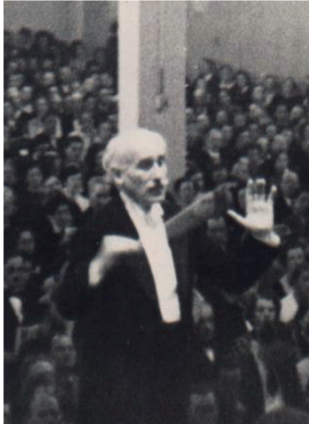
טוסקניני מנצח על התזמורת הפילהרמונית בישראל ב-1936