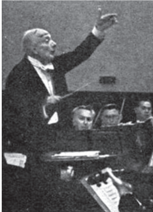
ברנרדינו מולינארי מנצח על התזמורת הארץ ישראלית 1945