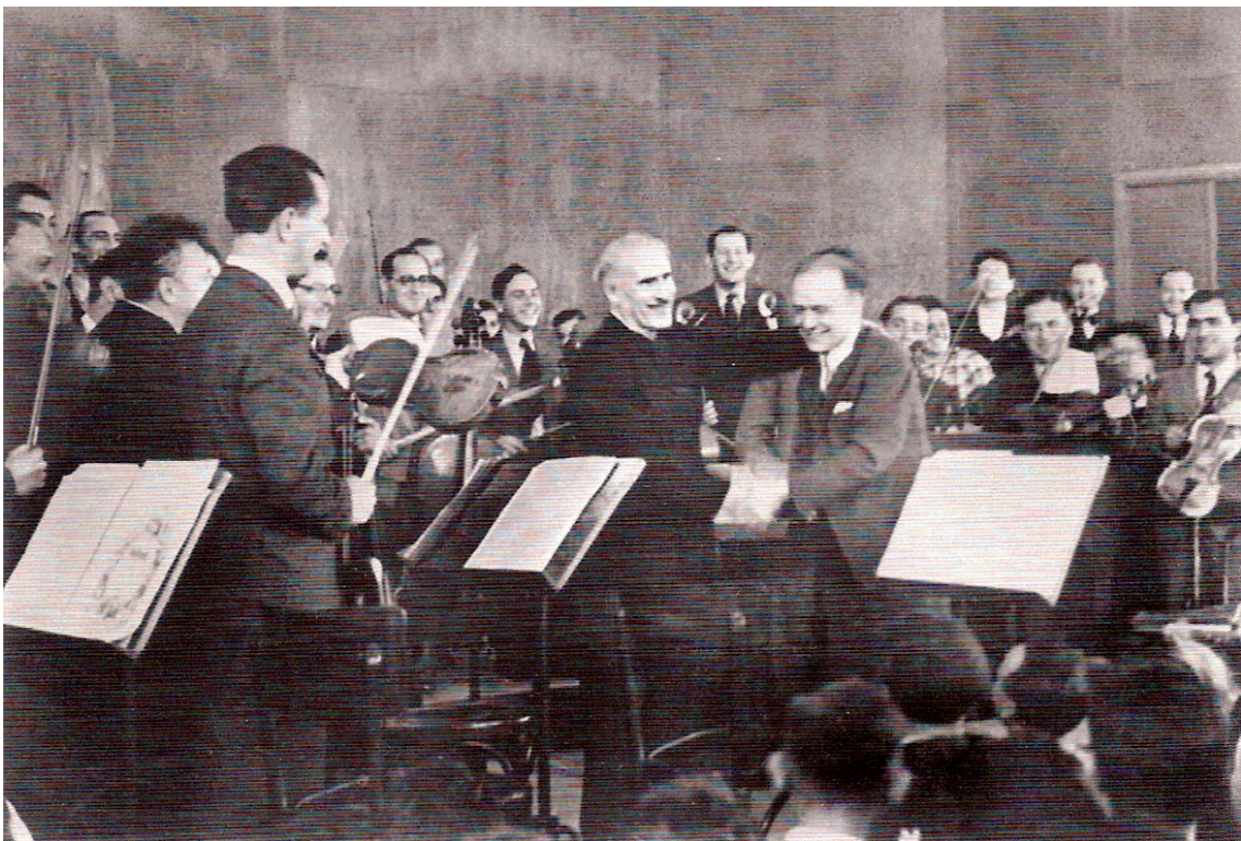
טוסקניני מנצח על התזמורת הפילהרמונית

ב-26.12.1936 קרה הנס – טוסקאניני הגיע לישראל! גדול המנצחים בעולם בארצנו הקטנטונת? היישוב כולו היה כמרקחה. בימים הקשים של מהומות דמים של ערבים נגד יהודים, צבאו אלפי אנשים על הקופות, בגשמים וברעמים, והתחננו לכרטיס. 3000 איש מילאו את אולם "התערוכה" בנמל תל אביב הישן שהוכן במיוחד. המדינה כולה לבשה חג. פתאום הפכה ארצנו הקטנטונת למעצמת מוזיקה ברמה בין-לאומית! נשים תפרו שמלות יוקרה לאירוע הממלכתי... מי לא היה שם – הנציב העליון, צמרת הממשל הבריטי, פרופ' חיים ויצמן, נשיא ההסתדרות הציונות (לימים הנשיא הראשון של מדינת ישראל), דוד בן-גוריון, ראש עיריית תל אביב ישראל וסגנו – כל ה"מי ומי".