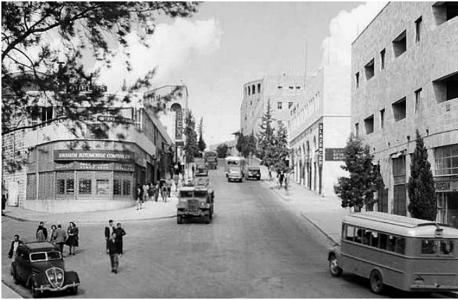
קולנוע "רקס"