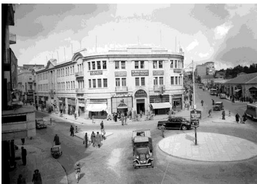
כיכר ציון בתקופת המנדט הבריטי

בכיכר זו, שכן מועדון " המרתף של סורמלו ". סורמלו, או