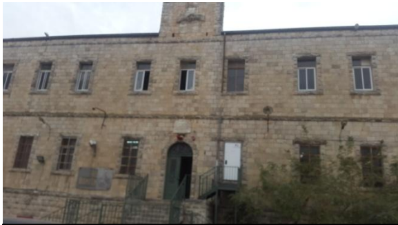
בית הספר אליאנס

גם הנשיא יצחק נבון, מתושבי השכונה המפורסמים, חזר בזיכרונותיו לבוסתן הספרדי. במחזה שכתב, "בוסתן ספרדי", הוא יצר קולאז' תאטרלי-מוזיקלי המספר את סיפורה של השכונה הספרדית אוהל משה בשנות השלושים של המאה ה-20. החיים התוססים של דיירי השכונה היו רוויים שירת קודש וחול, סיפורים משעשעים, הומור ושפת הלאדינו.