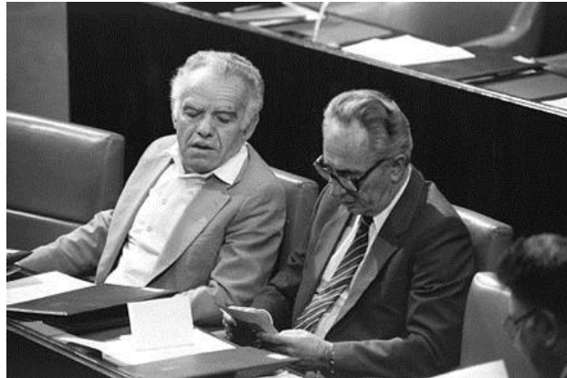
ראש הממשלה שמעון פרס וסגנו יצחק שמיר ליד שולחן הממשלה

להקמת הכור הגרעיני בדימונה. חזונו של פרס משפיע עד היום על צה"ל ועל מערכת הביטחון. הדחיפה הבלתי פוסקת מצידו לחדשנות מחשבתית וטכנולוגית היא חלק בלתי נפרד מתרבות צה"ל עד היום.