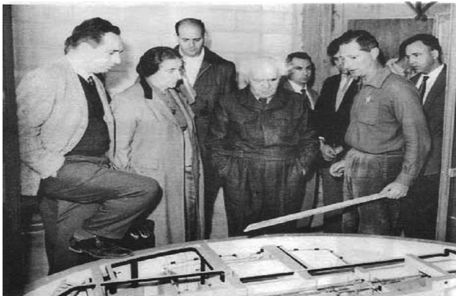
ביקור בכירים בכור בדימונה, 1960. משמאל: שמעון פרס, גולדה מאיר ודוד בן גוריון