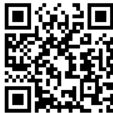
פרס והכור הגרעיני בדימונה