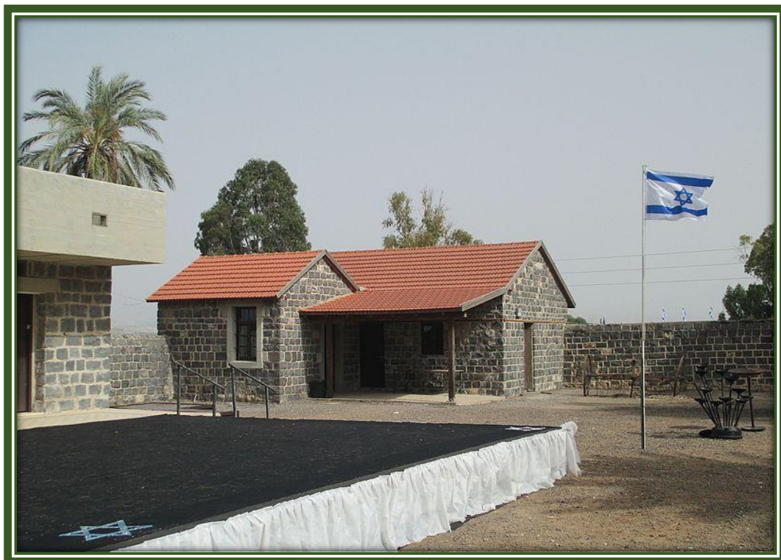
חצר כנרת