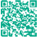
שבוע אהבה לטבע