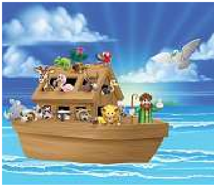
ידיעת סיפורי התנ"ך