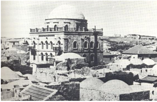
בית כנסת "תפארת ישראל"

את בית כנסת "תפארת ישראל" הקימו חסידי ר' ישראל פרידמן מרוז'ין. ר' ישראל פרידמן רכש את המגרש להקמת בית הכנסת, והרוח החיה בבנייתו הייתה ר' ניסן ב"ק. לכן נשא בית הכנסת שני שמות: השם הרשמי – בית הכנסת "תפארת ישראל"; והשם העממי – בית הכנסת "ניסן ב"ק". קהילת החסידים בירושלים קינאה בקהילת הפרושים על בניית ה"חורבה" ופעלה להקמת בית כנסת שלא ייפול בפארו מבית כנסת "החורבה".