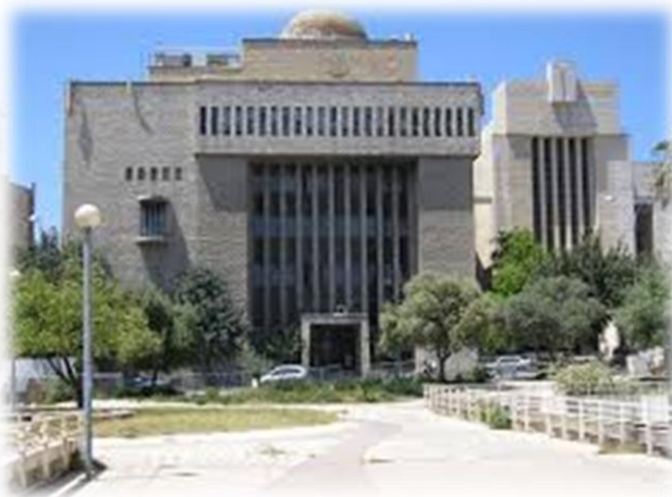
היכל שלמה

(מתוך נאומו של הרב גורן על הר הבית בפני הצנחנים משחררי ירושלים)