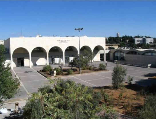
ישיבת חברון