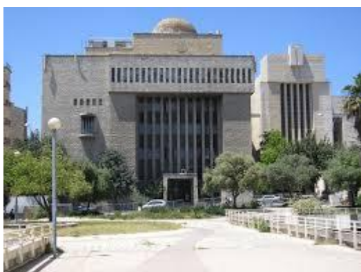
היכל שלמה

כבר בשנת 1923, פרסמו הרבנים הראשיים, הרב קוק והרב יעקב מאיר, קריאה להקמת בית כנסת מרכזי בירושלים: "הייתכן הדבר כי דווקא ביישוב היהודי הגדול שבירושלים הקדושה יחסר סמל האיחוד הסגולתי הזה של עם ישראל? (...) הייתכן להוציא ולהשמיע מפה לאוזן את המשפט המוזר, המופרך כל כך, והעובדתי בכל זאת, ולומר: לירושלים הגדולה והקדושה אין בית כנסת גדול ומרכזי?" (מתוך: