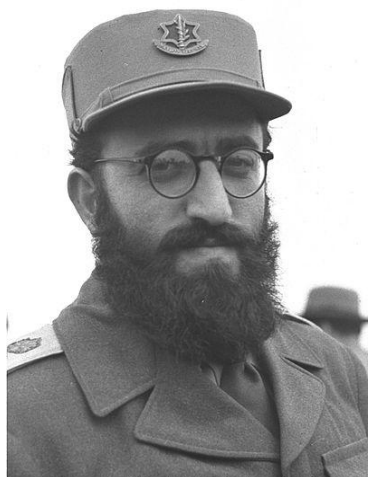
הרב שלמה גורן

(מתוך נאומו של הרב גורן על הר הבית בפני הצנחנים משחררי ירושלים)