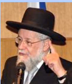
ישראל מאיר לאו

כתיבה: רננה אברון יעוץ פדגוגי: ציפי קוריזקי, רותי זוסמן עריכת לשון: שלומי ברנד המטה לתרבות ישראל.