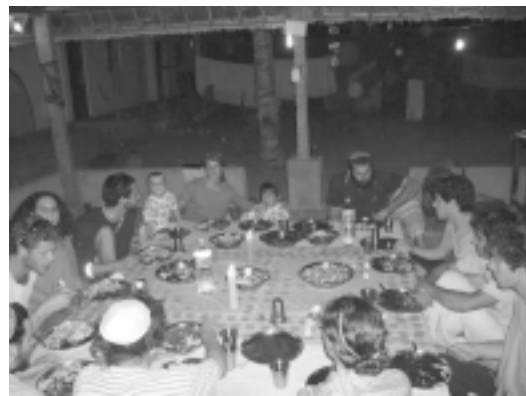
ארוחת ערב בבית היהודי בהמפי