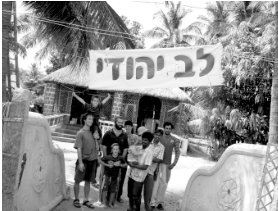
שליחי "לב יהודי", יובל ותמימה עדי וצוות העובדים היהודים בפתח בית לב יהודי בהמפי.