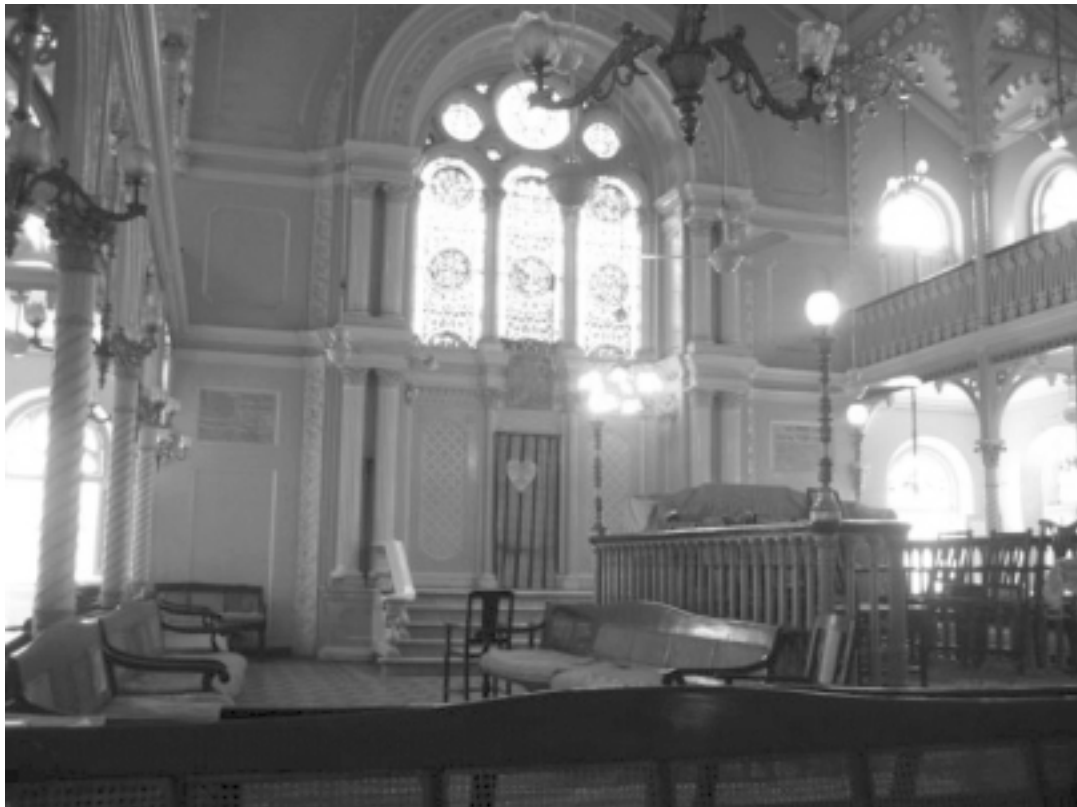
בית הכנסת "כנסת אליהו" במומבאי.

ספק גדול הוא, איפוא, אם שאלת Satyagraha מטעם היהודים "כלפי הערבים" בא"י היא במקומה. הצעירים העבריים היו להם מזמן יחידות של הגנה מאורגנת, ואלה הוכנסו עכשיו, על פי רוב, לתוך הכוחות של השלטון בארץ. עד כמה שידוע לי אינך טוען שיבטלו באיזה מקום שהוא את הכוחות של המשטרה ושל הצבא. כאן בארץ אין זכר אפילו למקרה אחד של התנפלות מצד הכוחות הרשמיים היהודיים. הייתי רוצה לשמוע ממך אם לפי דעתך צריכים היישובים היהודיים להישאר בלי כלי-זיון, או שיפרקו אותם עכשיו, ובשעה שכנופיות נכנסות לעיר כטבריה והורגים ומרטשים תינוקות בזרועות אמם, היו צריכים להציע "שיירו בם או שישליכו אותם לתוך ים המלח מבלי להרים את האצבע נגד אלה"? כפי שאני הבינתי את Satyagraha הרי בכדי לפעול את פעולתה יש להתייצב כך כלפי השלטון החוקי ולא כלפי כנופיות של שודדים ומרצחים.