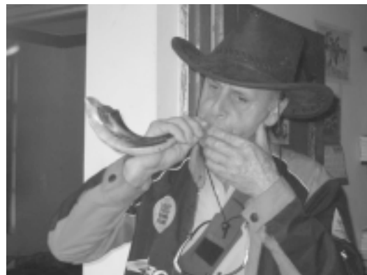
מטייל ישראלי בהודו מנסה כוחו בתקיעת שופר