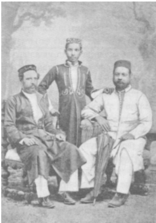
דמויות של יהודים מקוצ'ין. מכון בן צבי.