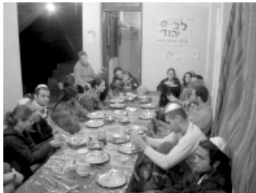
ארוחה בבית היהודי בדראמסלה 2005