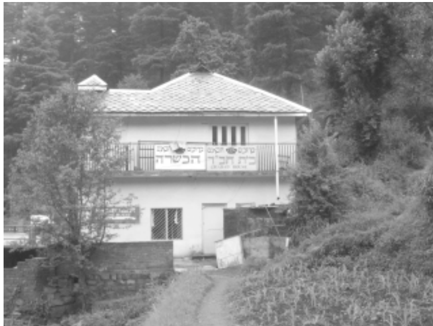
בית חב"ד בהרמקוט בהרי ההימליה.

פעם אחת, ספריית בית אל, תשס"ד, עמ' 39-42