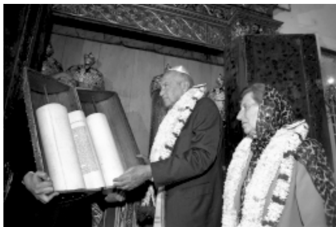
עזר וייצמן ואשתו ראומה בודקים ספר תורה בבית כנסת של יהודי קוצ'ין בהודו. 1997.