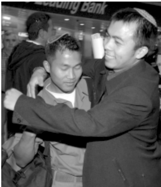
קבלת פנים לעולים מבני מנשה על ידי קרוביהם בנתב"ג. 2006.

האשכולות, בקיא וחריף ומעמיק בתורת ישראל. ניגשתי אליו ואמרתי לו: