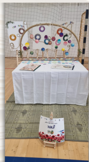
העמדה הבית ספרית