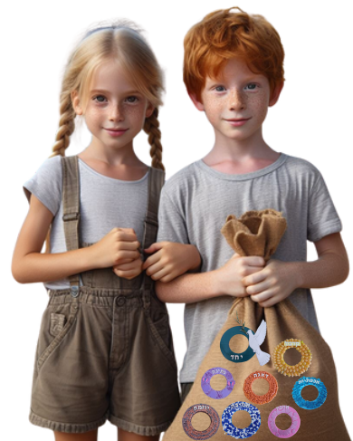
דמויות הסיפור: קארי ורעל נצרו באחוזא תמונת AI