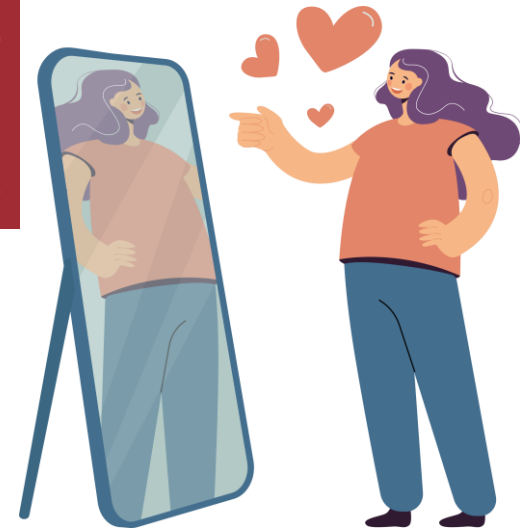
חזרה לתפריט הראשי

נסתדר בשתי שורות, נעמוד אחד מול השני, למשמע מחיאת כף של המורה, שני בני הזוג שעומדים זה מול זה יחפשו כמה שיותר פריטי מידע על עצמם בהם הם שונים זה מזה בתכלית השינוי. עם מחיאת הכף שורה אחת תזוז צעד אחד שמאלה (הקיצוני משמאל ירוץ מהר לקצה הימני של השורה) ושוב ינהלו את אותו שיח בזוגות החדשים. בתום המשחק נקדיש זמן לשיח בנושא – מה קורה לי כעאני אאה עונות ביני לבין אחרקי?