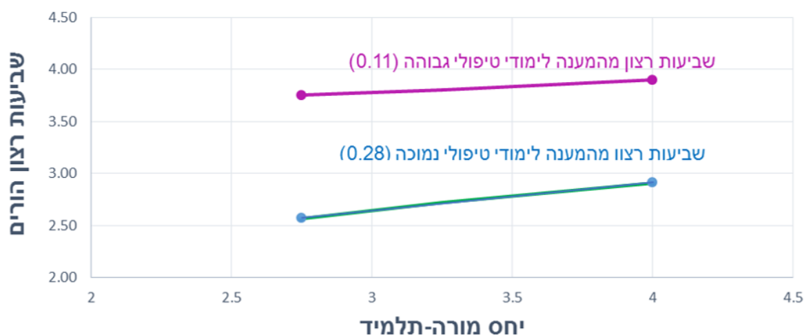
גרף 2: האינטראקציה בין גורמי יחס מורה-תלמיד ומענה לימודי-טיפולי בקשר עם שביעות רצון ההורים

בניתוח לבחינת מודל המיתון הוכנסו כל המשתנים הדמוגרפיים כמשתנים קו-וריאנטיים. משתנה יחסי מורה-תלמיד שימש כמשתנה מנבא, המענה הלימודי-טיפולי שימש כמשתנה ממתן, ושביעות הרצון הכללית של ההורים שימש כמשתנה מנובא. אפקט האינטראקציה נמצא מובהק, b = .09 , SE_b = .02 , p < .001 . האינטראקציה מוצגת בגרף 2.