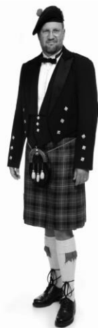
© "קילט" – לבוש סקוטי מסורתי

91 גם הלבוש הוא חלק מהצופן החברתי. 92 למשל, בעבר הרחוק גברים נהגו ללבוש 93 שמלות, אם כי שונות מהשמלות של 94 הנשים, ואילו היום גברים 95 לובשים בעיקר מכנסיים. עם 96 זאת בתרבויות מסוימות 97 אפשר לחזות היום בגברים 98 הלבושים בחצאיות. הדוגמה 99 המוכרת ביותר היא ה"קילט" 100 הסקוטי – חצאית משובצת 101 בגובה הברך שהגברים 102 הסקוטים נוהגים ללבוש 103 באירועים חגיגיים מסורתיים.