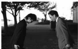
© קידה - ברכת שלום ביפן