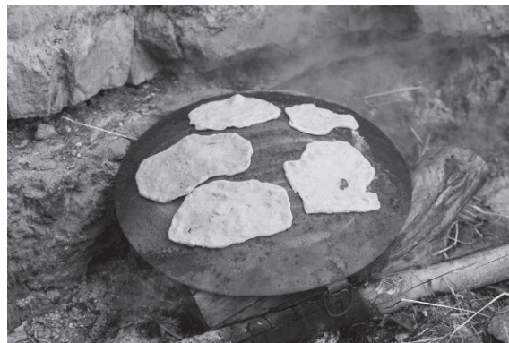
אפיית פיתות על פלי ברזל עגול

סוג הלחם קשור לא רק לתנאי האקלים אלא גם לכלים העומדים לרשות האדם בכל אזור. למשל לשבטי נוודים החיים במדבר אין תנורי אפייה, ולכן הם אופים פיתות ישירות על גחלי המדורה או על פלי ברזל עגול הדומה למחבת הפוכה. הפיתה מוכרת בישראל ובארצות רבות במזרח התיכון ויש לה מגוון צורות וטעמים.